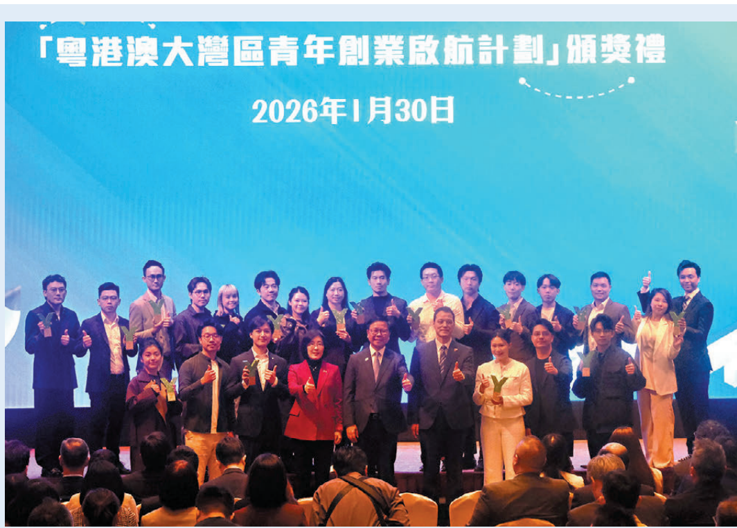
●粵港澳大灣區青年創業啟航計劃。