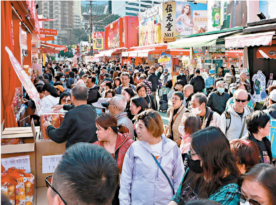
●去年本港私人消費開支實質增長1.6%，扭轉此前跌勢。