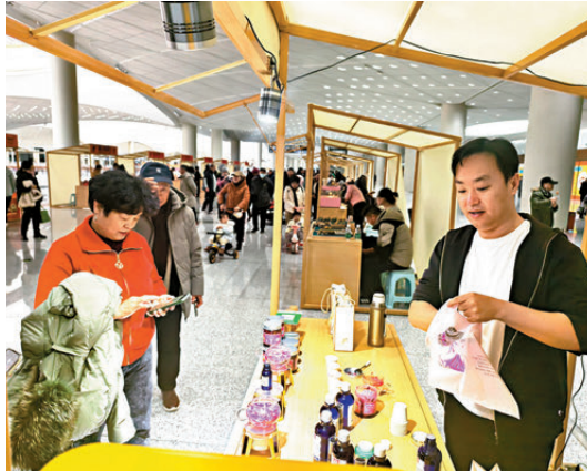
●通州站內市集。