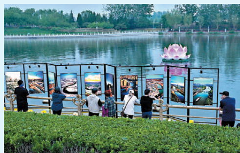
●運河邊的藝術展。

北京城市副中心致力於在綠色標準制定上走在全國乃至世界前列，作為中國唯一城市代表，在巴西里約熱內盧召開的聯合國氣候大會（COP30）地方領導人論壇暨C40全球市長峰會上榮獲「地方氣候領袖」獎，標誌着北京城市副中心的探索獲得國際認可。