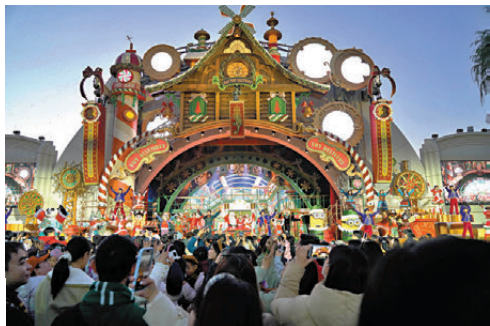
●2025年11月14日，在北京環球度假區拍攝的冬季限定演出「最棒的禮物」。

清晨的通州站地下進站大廳，人流井然有序。作為全地下設計的超級樞紐，這裏整合了城際鐵路、城市軌道、接駁場站等多元功能，地下三層空間實現「一站式換乘」。2025年12月30日這一天，亞洲最大地下綜