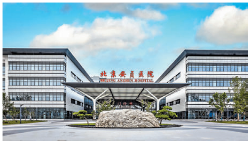
●副中心已集聚7家三級公立醫院，安貞醫院還與北三縣簽署心血管醫聯體協議，讓京津冀患者共享優質醫療資源。