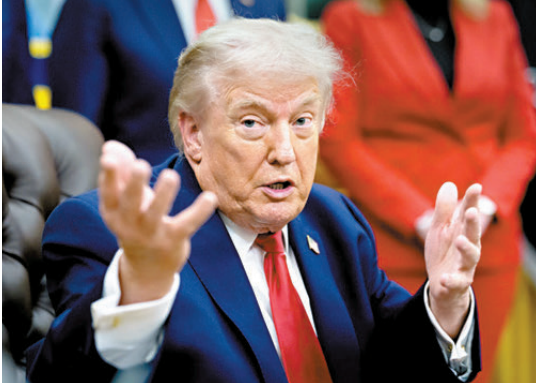
●特朗普以個人身份提出訴訟。

到，騙徒隨後轉而冒充未涵蓋在首個指令範圍內的其他人士。在新指令下，Meta須強化人臉識別機制，並優先處理新加坡用戶的舉報，但打擊對象將擴大至冒充其他個人的詐騙活動。Meta須分階段落實相關措施，在1月31日或之前把措施適用範圍延伸至未納入首個指令的政府官員；在2月28日或之前進一步涵蓋警方評估為較高風險，且曾被冒充一事報案的本地人士。