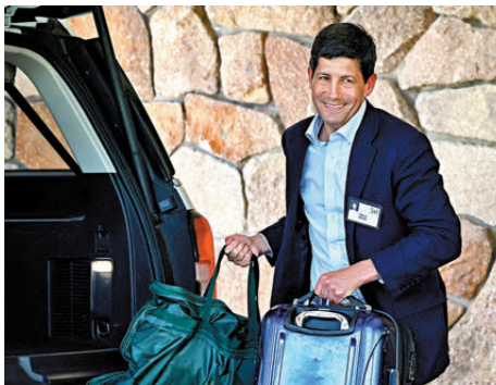
●沃什曾於2006年至2011年擔任聯儲局理事。

特朗普周四在今年首次內閣會議上表示，聯儲局應大幅減息約2至3厘，美國利率應維持在世界最低水平，他並再次批評鮑威爾拒絕減息。在會議舉行前一日，聯儲局議息會議公布維持利率不變，並將聯邦基金利率目標維持於3.5厘至3.75厘區間。