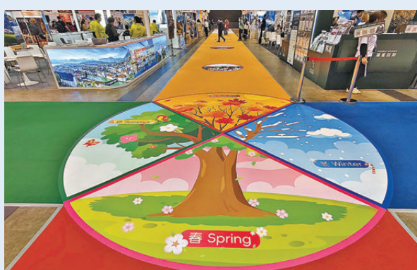
●旅遊博覽大道以春、夏、秋、冬形式呈現。

今年大會特設「北歐專區」，以延續冬季節日氣氛，以充滿北歐氣氛的聖誕樹、鹿車等裝飾布置，並設有專屬影相打卡位。而「旅·攝·展」以「節慶之旅·定格當下」為主題，展出多位攝影師及旅遊愛好者的精彩節慶之旅主題作品，引領觀眾透過影像感受世界各地節慶文化的歡樂氛圍，發掘文化深度遊的好去處。