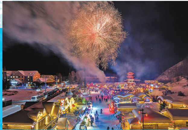
●雪村的煙火氣藏在冷暖交織間。

雪道上，身影如流光穿梭，與冰雕雪雕園的晶瑩景致相映成趣。聖泉雪集的熱鬧、潮嘍巷的煙火、熱力mall農創美食公園的鮮香，交織成度假區的冬日樂章。正如習近平總書記曾盛讚的「阿爾山自然風光四季都很美」，這份美在冬日尤為濃烈，從五里泉濕地公園的雪色蒼茫，到阿爾山火車站的復古風情，每一處景點都藏着冰雪的饋贈。