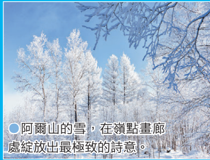
○阿爾山的雪，在嶺點畫廊處綻放出最極致的詩意。

哈拉哈河此段因地下溫泉湧動，即便在-40℃的極寒天氣裏，依舊流水潺潺，水汽蒸騰而上，在兩岸樹木上凝成濃密霧凇，延展成數公里的霧凇長廊。清晨漫步河畔，霧氣與雪色交織，偶有牧民趕着牛群從霧中穿行，牛蹄踏雪的輕響混着流水聲，打破林間寂靜，構成一幅流動的北國牧歌圖。若敢挑戰極寒漂流，乘皮筏順流而下，兩岸瓊枝玉樹掠過身旁，便似闖入仙境尋幽，冷冽寒風與溫潤水汽在鼻尖碰撞，是獨屬於阿爾山的感官盛宴。