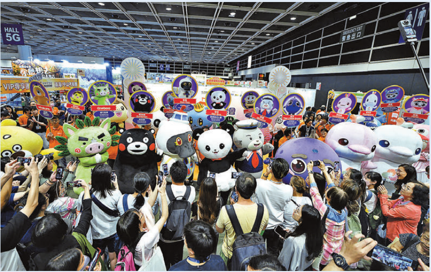
●去年旅遊博覽的吉祥物巡遊，吸引不少參觀者打卡。