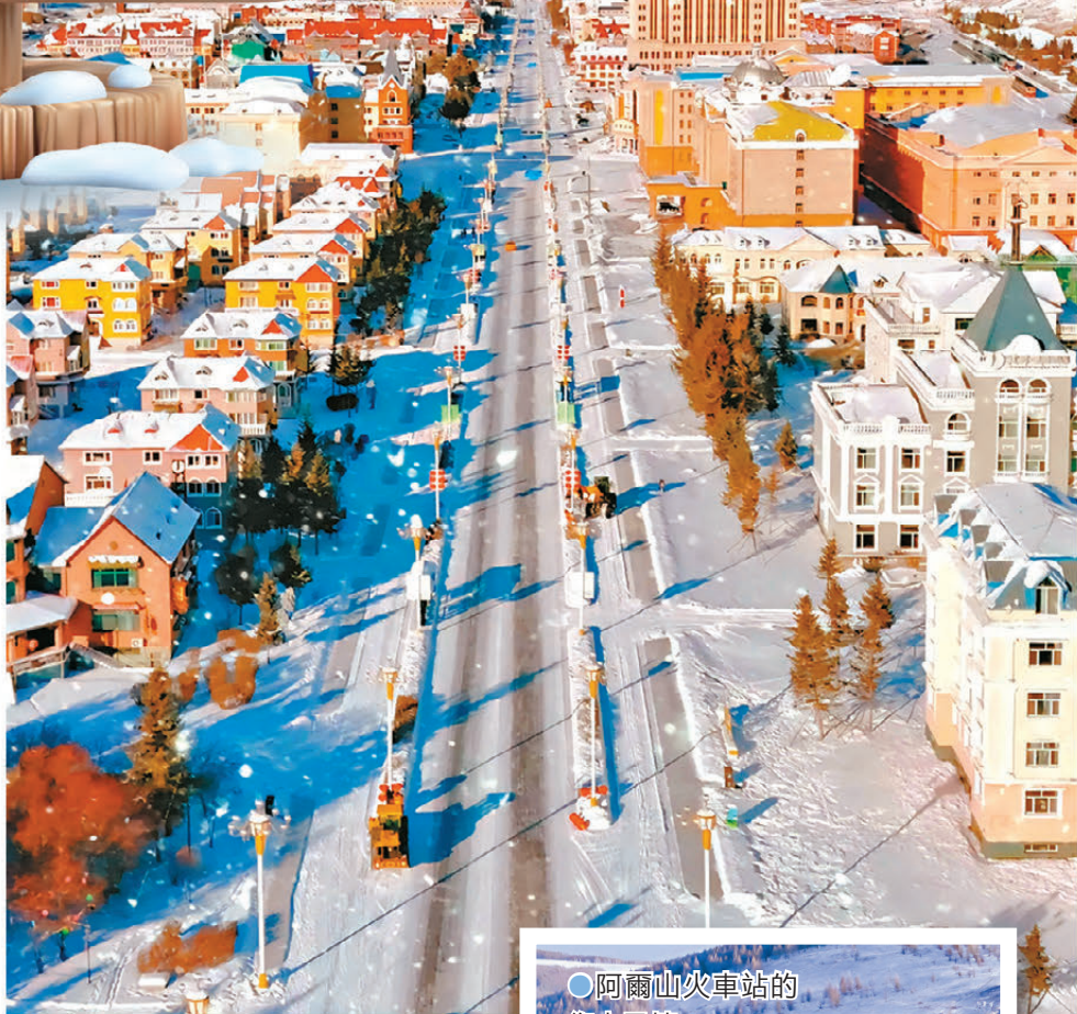
○阿爾山國家級旅遊度假區坐落於溫泉街核心區域。