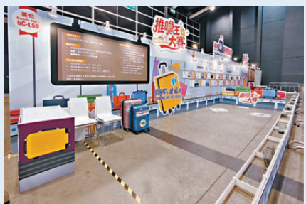
●互動遊戲「推鴨王大賽」