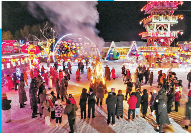
●遊人在冰天雪地中尋得愜意。