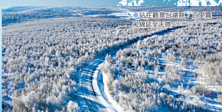
○站在觀景台遠眺，百里霧凇綿延至天際。