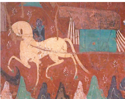
●257窟《鹿王本生》中為國王拉車的白馬特別有個性。

這種高度概括的表現方式，不僅符合佛教敘事的象徵邏輯，也展現了敦煌畫匠超越現實的想像力——畫裏的馬，不只是馬，而是奔騰的生命與精神。中國傳統中的馬年就要來了，敦煌壁畫裏還有好多關於馬的藝術創作，接下來我將陸續和大家分享。