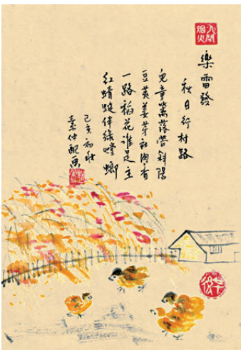
樂雷發 秋日行村路 兒童籬落帶斜陽，豆莢莢芽社肉香。 一路稻花誰是主？紅蜻蜓伴綠螳螂。 己亥初秋 素仲配畫