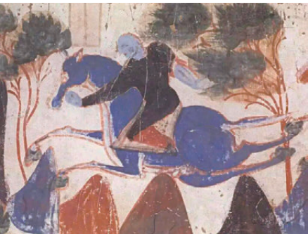
●428窟壁畫中王子騎的藍色駿馬四蹄幾乎與地面平行。