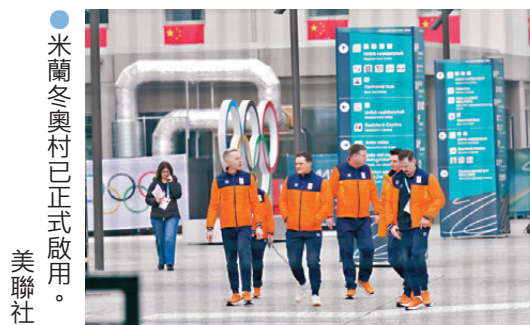
●米蘭冬奧村已正式啟用。

值得一提的是，由於本屆冬奧會賽區較為分散，除米蘭冬奧村外，組委會還在科爾蒂納、博爾米奧、利維尼奧等地設立了相應冬奧村，為運動員提供便捷保障。