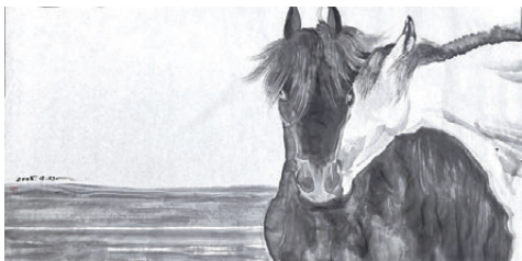
● 《相守》紙本設色 68cmx138cm。(2026年) 作者畫作

《相守》便是這一漫長求索凝練的視覺表達。畫面中，兩匹蒙古馬緊密相依，形成一個不可分割的生命共同體。一匹黑馬靜立，透着沉默的恒久力量；另一匹白馬依偎在側，脖頸以全然信任的弧度柔順傾靠，宛如最溫柔的交付。牠們的軀體貼合，已昇華為氣息與體溫的交融；眼簾低垂，目光共同望向畫面之外安詳的遠方，那是一種共同歷經跋涉後無須言語