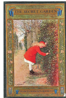
● 1911年版的《秘密花園》封面。

感謝母校基金會的暖心情誼，送予的豈止是擴香？這段詩情畫意的片言隻字，引發起心靈的頓悟與療癒。其實，我們每個人的心裏，都擁有一個秘密花園，要時刻澆水、疏土，偶爾施肥，既要陽光，又要保持溫潤，需耐心看守照顧而無忘初衷，切忌因世間凡塵俗務，讓「心園」荒廢封塵！