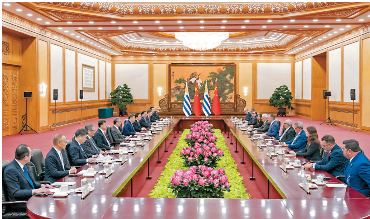
▲▲2月3日上午，國家主席習近平在北京人民大會堂同來華進行國事訪問的烏拉圭總統奧爾西舉行會談。