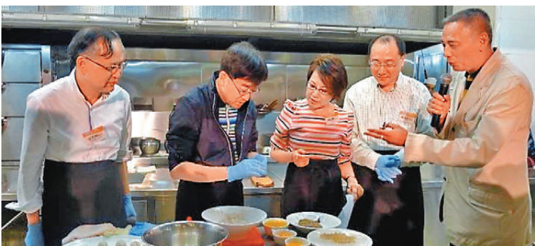
●基金會於2014年舉辦的烹飪大賽旨在讓腎友「食好啲」，也邀公眾「食醒啲」。

預防的腳步，也走向更高的起點。2025年3月，基金會於山頂廣場舉辦第20屆世界腎臟日暨第五屆香港腎臟日，以「山頂起步 與腎同行」為主題，鼓勵市民日行萬步，關注腎臟健康。這僅是基金會全面推動腎健