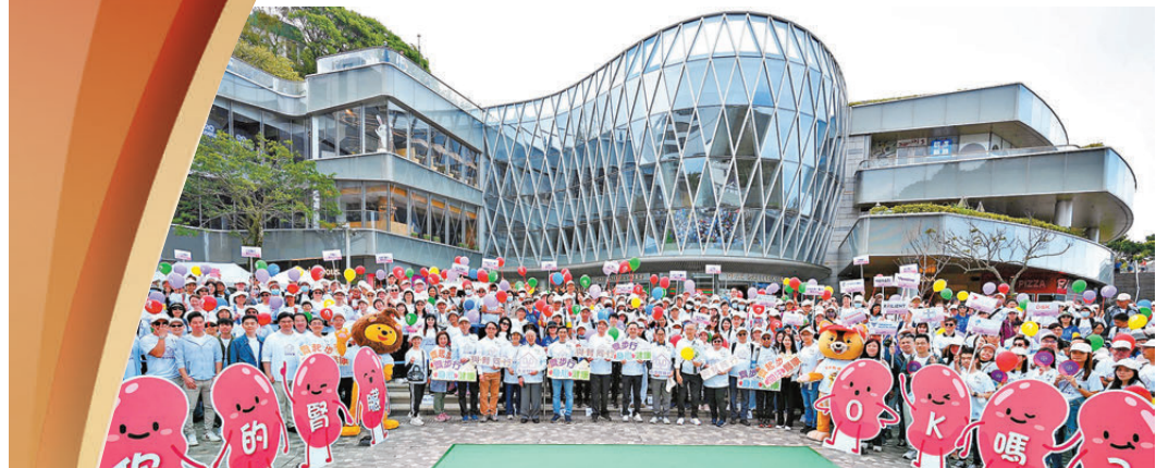
●2025年3月，第20屆世界腎臟日暨第五屆香港腎臟日活動於山頂廣場舉行。