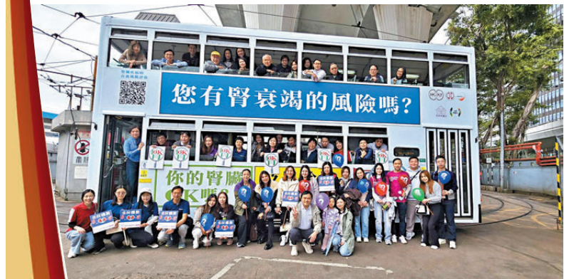
●醫護團體日前登上叮叮車沿途宣傳腎臟健康。