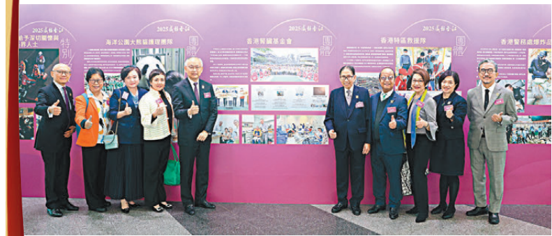
●香港腎臟基金會獲選為「2025感動香江」團體之一。