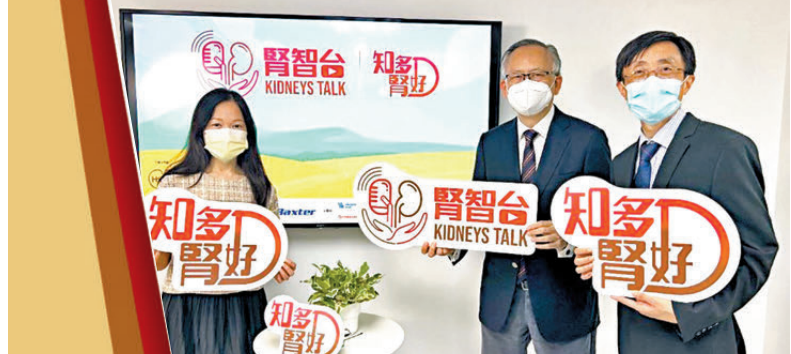
●香港腎臟基金會通過「腎智台」網上講座普及腎臟知識。

近日，香港腎臟基金會榮膺「2025感動香江」團體殊榮。評委會讚譽，這艘慈善方舟以「公平治療」為核心槳楫，破開了由經濟負擔築成的絕望冰河，不讓貧弱差異影響治療的尊嚴，成功搭建起跨越社會階層的生命橋樑。香港腎臟基金會是由梁智鴻醫生、余宇康教授等於1979年創立的非牟利慈善機構，從沙田洗腎中心全部21部血液透析機的換新啟用，到已有逾千部自動腹膜透析機投入服務，覆蓋患者居家治療需求，這艘方舟的裝備日益精良。在基金會主席雷兆輝醫生看來，硬件的完善標誌着一個里程碑的建成——讓腎病患者獲得更好的治療，過上有尊嚴的復康生活。然而，對主席雷醫生、兩位副主席李俊生醫生和王偉民，以及一眾基金會董董而言，使命從不止於治療。在穩固了生命支持的前線後，他們正將目光投向更根本的源頭——推動全民腎臟健康教育，從「上游」守護社區健康。