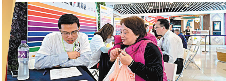
●醫護人員走入社區，為市民普及腎臟知識，提供用藥諮詢。