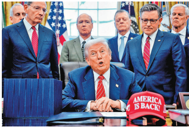
●特朗普在共和黨人見證下簽署撥款法案。

政府撥款法案塵埃落定，卻是另一場戰役起點。因應民主黨要求，國土安全部目前僅獲為期兩周的經費。在明尼阿波利斯發生聯邦執法人員開槍擊斃兩名公民事件後，民主黨要求對移民執法施加更多限制，特別是對負責執行全國移民法律的美國移民及海關執法局(ICE)。