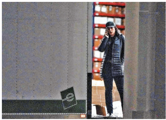
●加巴德用自己手機致電特朗普。

美國官員透露，特朗普親自下令加巴德前往亞特蘭大參與搜查行動，並與FBI副局長里里協調。在兩黨執政期間均曾擔任司法部資深官員的勞夫曼指出，總統直接參與國內刑事調查工作，特別是跟個人恩怨有關、把國家情報總監當作貫徹政治意志工具的調查，「背離多年以來的健全政策」。據報特朗普準備為當年落敗存在舞弊提出刑事訴訟，