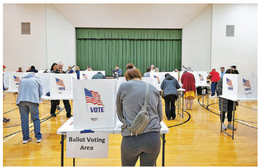
●特朗普宣稱自己2020年大選落敗，源自大量非法移民非法投票。 資料圖片

最新競選財務申報顯示，特朗普正籌集巨額資金鋪路中期選舉。截至去年12月底，特朗普的政治委員會與共和黨全國委員會共籌集4.83億美元(約37.7億港元)，較民主黨全國委員會、民主黨兩院委員會和超級政治行動委員會的1.67億美元(約13億港元)多出近兩倍。