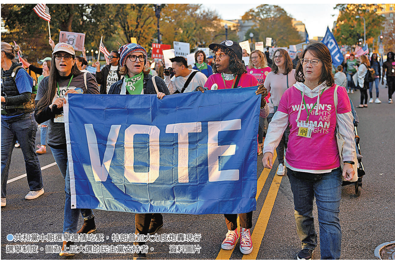
●共和黨中期選舉選情吃緊，特朗普加大力度炮轟現行選舉制度。圖為上屆大選的民主黨支持者。