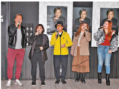
●眾人為演唱會綵排。

華哥近期跟明星足球隊到內地比賽，農曆年期間會休息。謝寧不知華哥會唱歌，三哥解釋他們總有一兩首飲歌傍身。提到三嫂戚美珍也開金口，三哥說：「以前大家看EYT（《歡樂今宵》）就會聽到，只是現在年紀大就少唱。」謝寧笑稱可贊助三哥和三嫂開騷，三哥不敢接，怕謝寧會傾家蕩產。