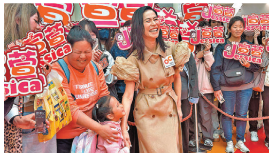
●宣萱被小妹妹的舉動逗得笑逐顏開。

活動完結時，宣萱走近人群與粉絲合照，一名小妹妹牽着她的手緊貼臉頰，逗得她笑逐顏開，