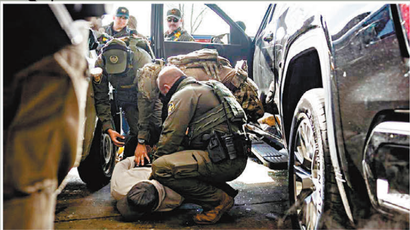
●ICE執法人員在芝加哥執行逮捕移民任務。