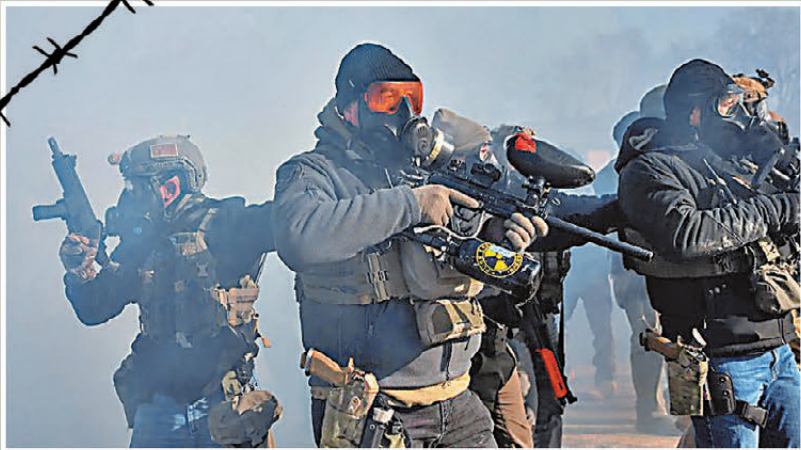
●ICE執法人員身穿便衣戴面具，全副武裝舉槍對準抗議人群。網上圖片