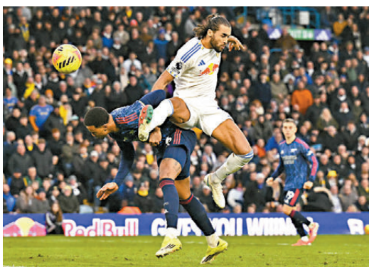
●列斯聯射手卡維特利雲（白衫）狀態火熱。