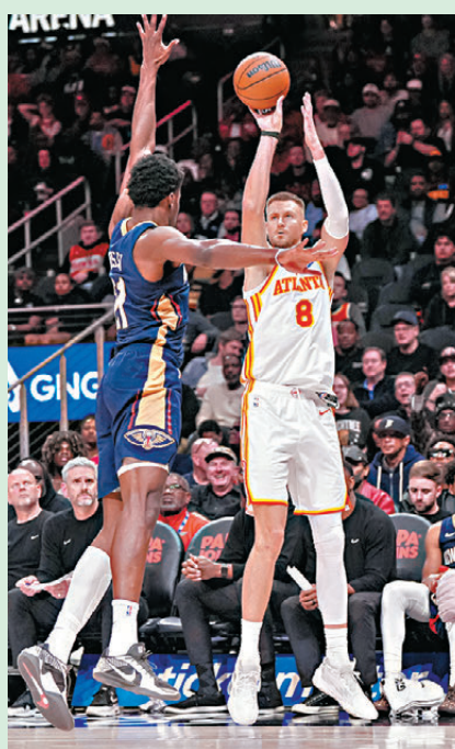
●勇士換入波辛基斯（右）輔助史提芬居里。

此外據《ESPN》報道，勇士在占美畢拿提早收咧後迎來首宗補強，將前鋒古明加與射手希迪希特交易至鷹隊，換來夢寐以求的「空間型長人」波辛基斯，其外投能力有助分擔陣中王牌史提芬居里的進攻負擔，然而「傷病史」卻成最大隱憂。