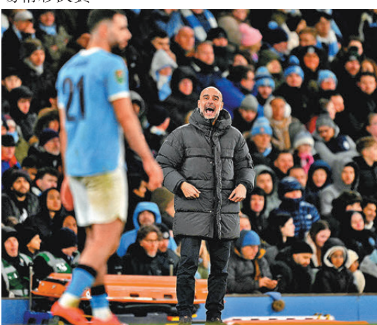
●哥迪奧拿領軍曼城淘汰紐卡素，晉身聯賽盃決賽。

曼城在哥迪奧拿帶領下，對上四次殺入聯賽盃決賽均順利捧盃，「紐卡素是歐聯級數的球隊，要擊敗他們並非易事，但我們所有球員都發揮出色，10年內五次打入聯賽盃決賽是偉大成就。」曼城上一次在決賽與阿仙奴交手已是2018年聯賽盃決賽，阿仙奴現時主帥阿迪達當年還在曼城擔任哥帥副手，今季聯賽盃將是師徒兩人首次在大賽決賽碰頭。哥迪奧拿大讚阿仙奴是目前歐洲甚至世界最強球隊，認為兩隊將合演一場精彩決賽。