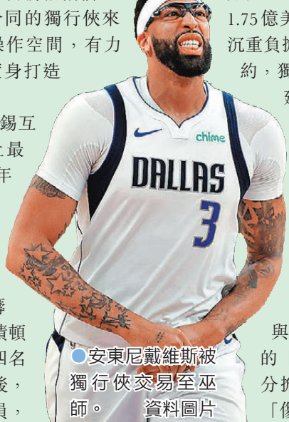
●安東尼戴維斯被獨行俠交易至巫師。

去年安東尼戴維斯與當錫互換東家，被喻為NBA史上最震撼交易之一，未料僅一年後「一眉」又被交易走，巫師以米杜頓、AJ莊遜、馬拉基班咸、馬雲巴格利以及兩個首輪籤、三個次輪籤作為籌碼，換來安東尼戴維斯、積頓夏迪、D羅素及丹迪艾蘇四名球員。這亦是繼特雷楊格後，巫師再次獲得全明星級球員，