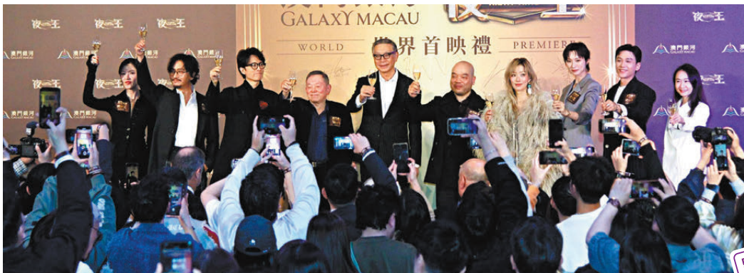
● 眾人舉杯預祝《夜王》票房大賣。

二人大讚戲中有很多有潛質的新演員，問到對票房有沒有信心，子華笑稱壓力不大，反而擔心自己會害羞，亦相信大家會看得開心。子華貴為擁有過億票房的男演員，自言之前的電影大收時都有問過點解，覺得很夢幻，已超出認知。Sammi則自嘲自己的票房紀錄最多僅3,000萬元，因起點低所以無壓力，但也想嘗試