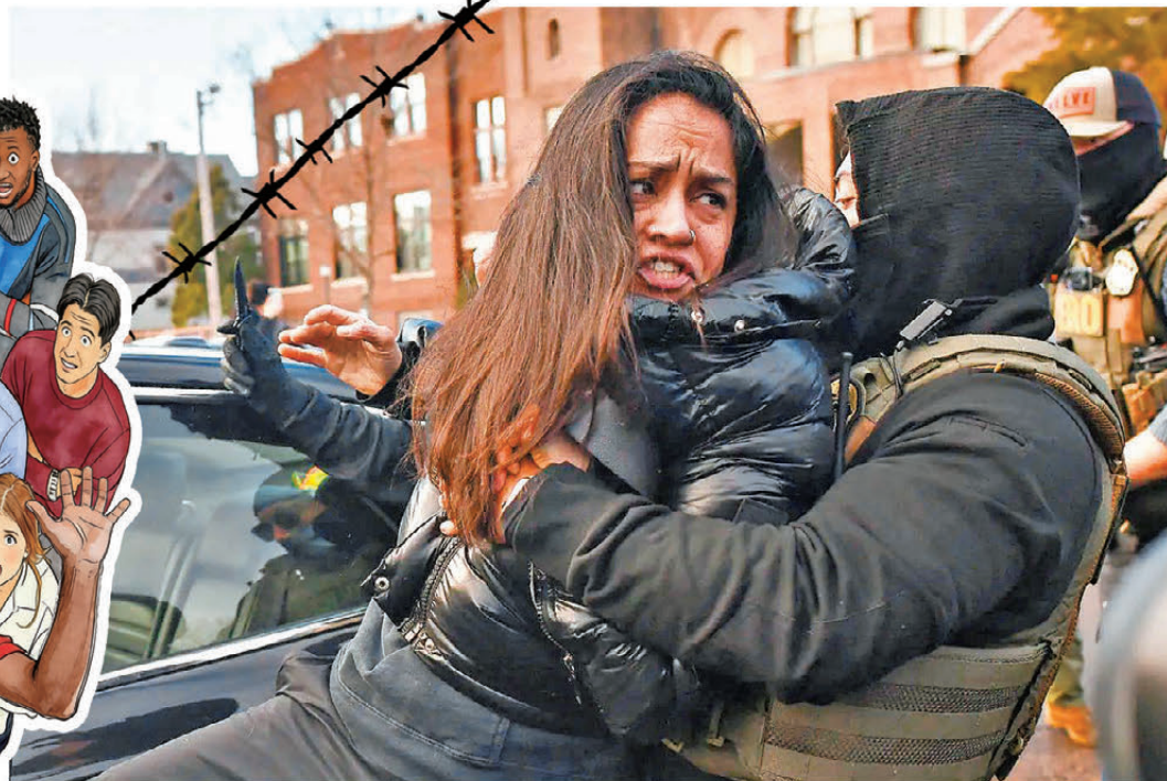
●ICE人員在執法行動中以膚色等特徵拘捕非法移民。