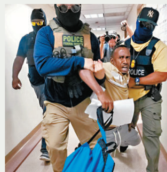
●最高法院准ICE將種族納入執法的懷疑考量。