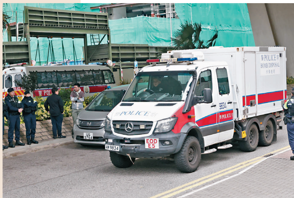
●警方出動爆炸品處理車。