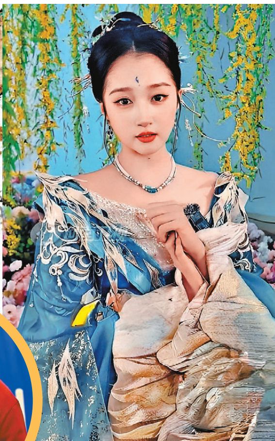
▲岳雲鵬送上新春祝福。視頻截圖