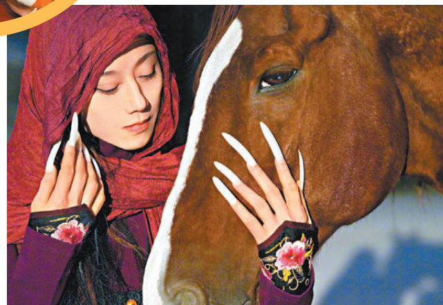
●楊麗萍將以馬為題編舞。