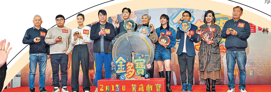
●眾人齊撐《金多寶》首映。