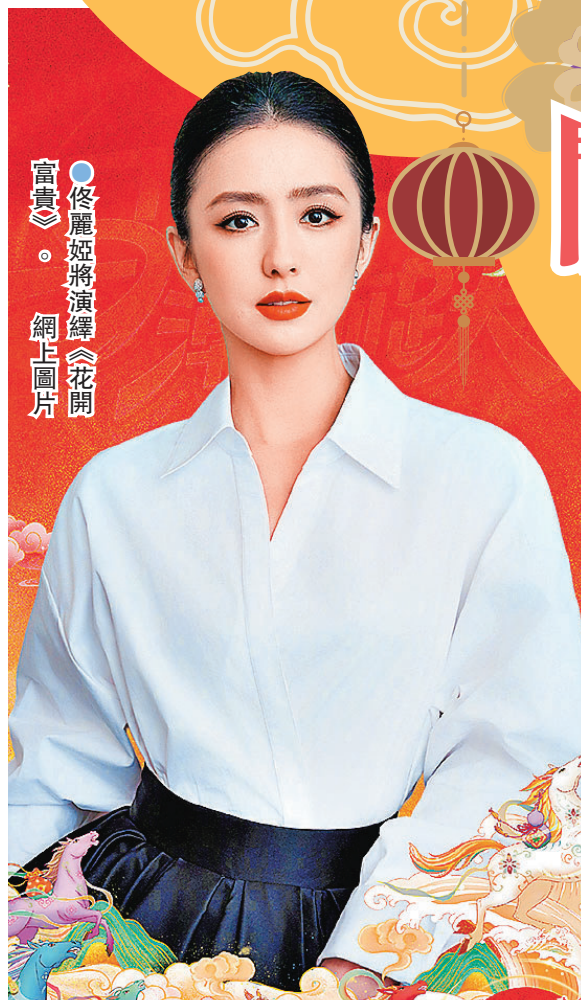
●佟麗婭將演繹《花開富貴》。