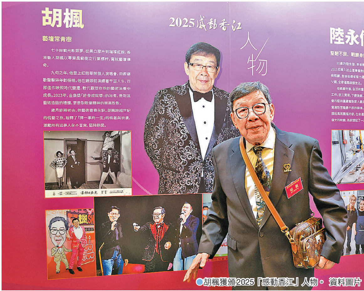
●胡楓獲頒2025「感動香江」人物。資料圖片

胡楓參與公益事業與政府活動，反映了演藝人員在社會中的責任與角色。他以自身的知名度推動慈善，並以身作則，提醒公眾「做好自己，幫助他人」。他的行動不僅提升了社會對長者的關注，也鼓勵更多市民參與公益。