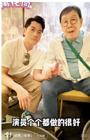
◀胡楓積極更新社交平台，訪問多位重量級嘉賓。網上截圖