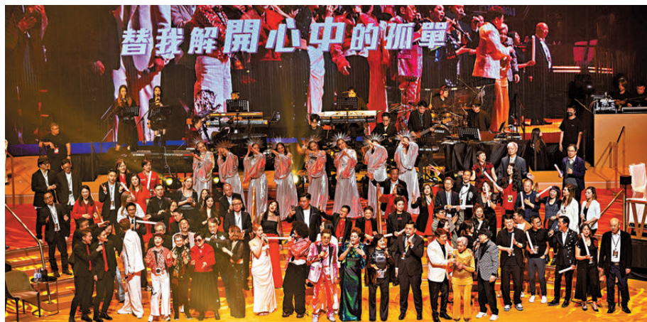
●人緣好的胡楓每逢舉行演唱會，均獲多位圈中好友支持。