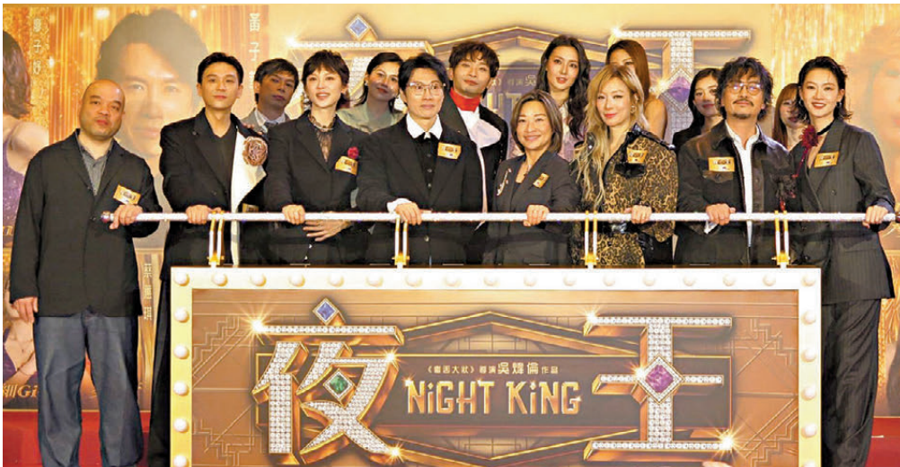
●《夜王》舉行香港群星首映禮。