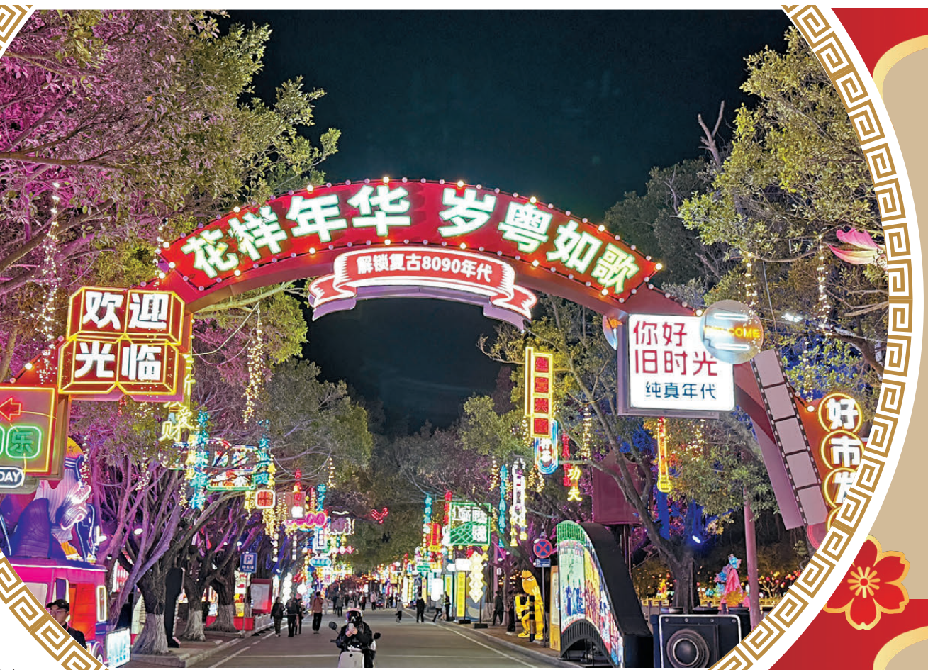
●2026年大灣區燈會10日晚亮燈迎客，港風「回憶殺」等獨具灣區特色的設計成為燈會一大亮點。

2026年粵港澳大灣區燈會以「灣區同心·華彩千秋」為主題，總面積達800畝，主遊線路長達2.5公里，設置五大展區，打造上百組大型主題燈景。香港文匯報記者現場採訪發現，與傳統燈會「只可遠觀」相比，本屆燈會讓每一盞燈都成為