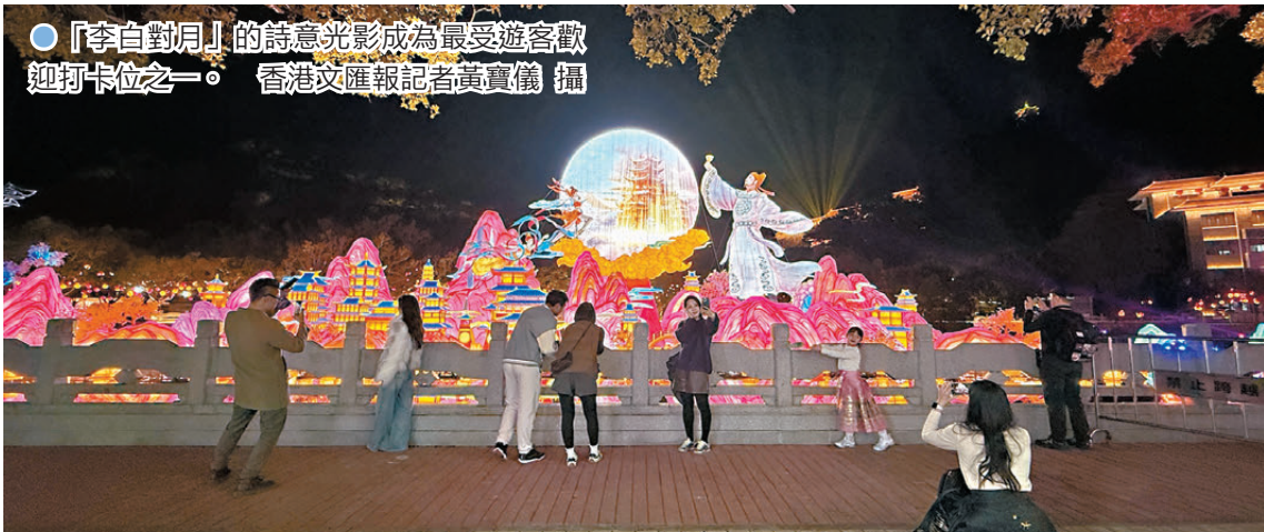
●「李白對月」的詩意光影成為最受遊客歡迎打卡位之一。

據介紹，本屆燈會持續展出至5月10日，展期長達90天。其間，燈會將有近千場演藝節目輪番上陣，還將開展電競比賽、動漫演出等豐富活動，結合中哈音樂節等跨國演藝，串聯多場潮流文旅活動，打造從新春持續到五月的超長文旅盛宴。本屆燈會還聯動區內特色景點，特別推出「一票暢遊南沙」、餐飲消費券等多重優惠活動，遊客可以賞燈海、遊濕地、坐郵輪、品美食，在全域遊覽中領略「一步一景、一路一樂」。