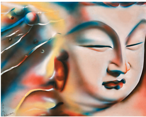
●趙海天《彼岸(二) 釋迦摩尼》1984年