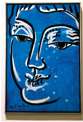
●趙海天《佛在人間(藍-陰)》1998年