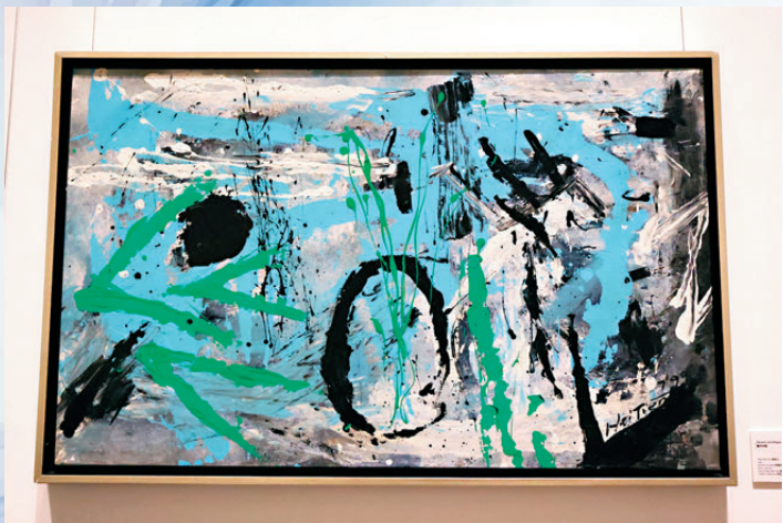
●趙海天《龍的回憶》1999年