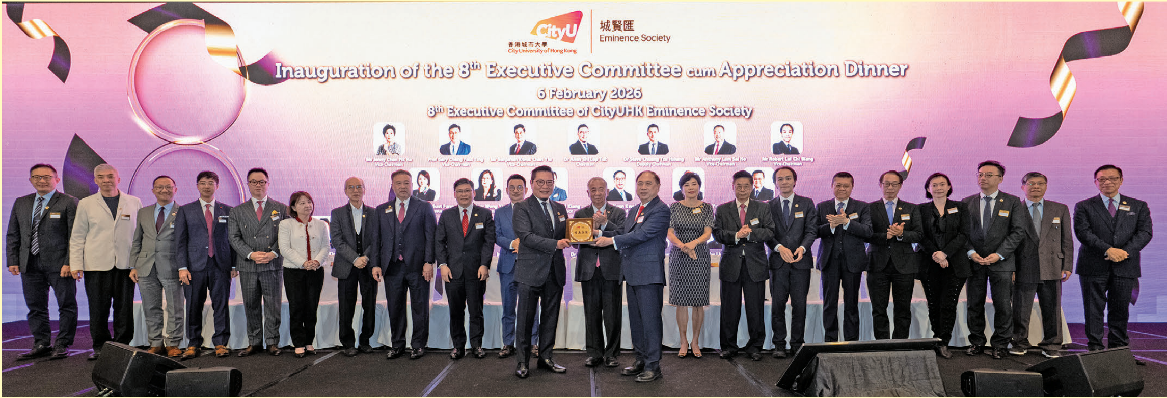
●「校友會印信」交接儀式。

城賢匯屬獨立註冊校友組織，由一群具熱誠並支持母校發展的城大校友於2010年正式成立，致力貢獻他們的專業知識和資源予城大及社群。城賢匯舉辦不同活動以擴大會員網絡，豐富經驗，並與不同組織合作，為會員、大學和社群帶來正面影響。欲了解更多詳情，請瀏覽網址： https://www.cityues.org/