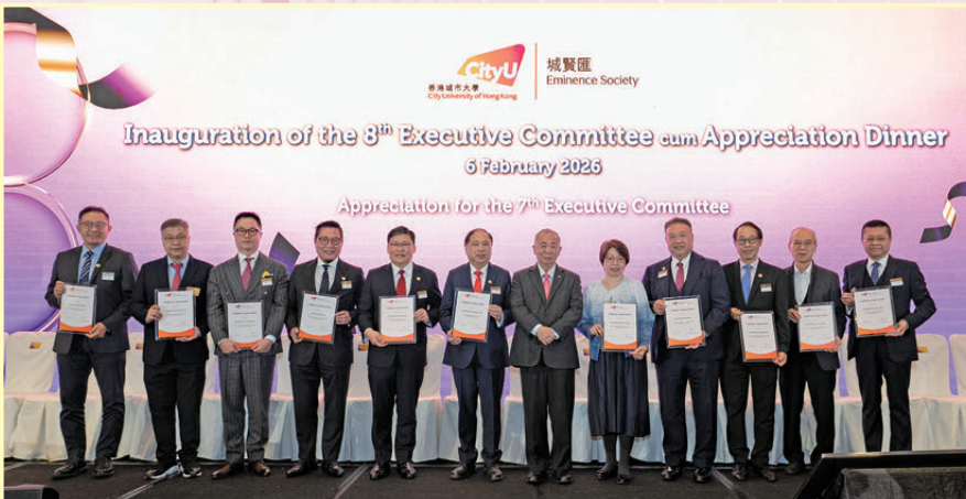
●城賢匯第七屆理事會。