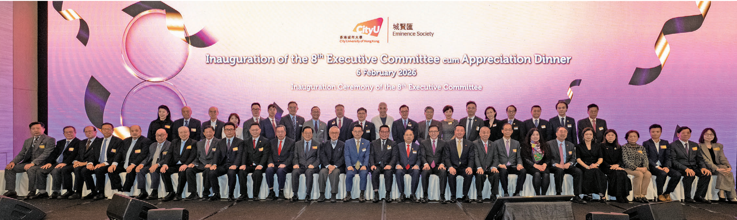
●城賢匯第八屆理事會就職典禮暨感謝晚宴嘉賓合影。