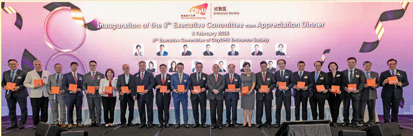
●城賢匯第八屆理事會。