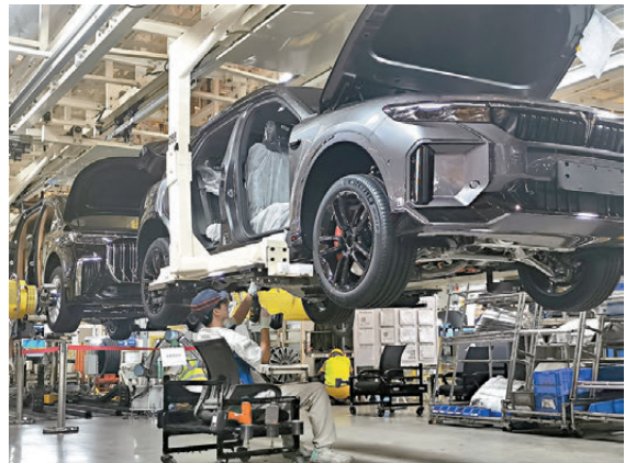
●嵐圖在武漢的一處生產車間。

據悉，2026年，嵐圖汽車計劃推出4款新車，全部搭載L3級智能輔助駕駛硬件，包括將在3月上市的央國企首款按L3級架構設計商用量產第一車嵐圖泰山Ultra和嵐圖泰山黑武士。