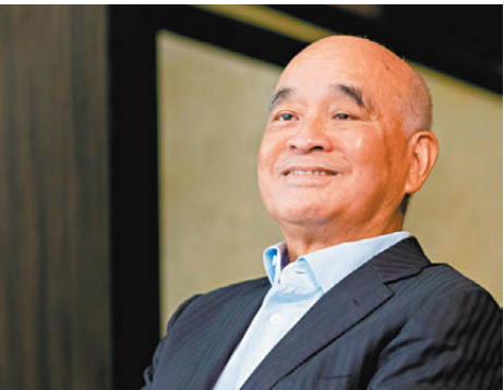
●新世界發展陷入債務問題，但鄭家純身家仍持續增加。