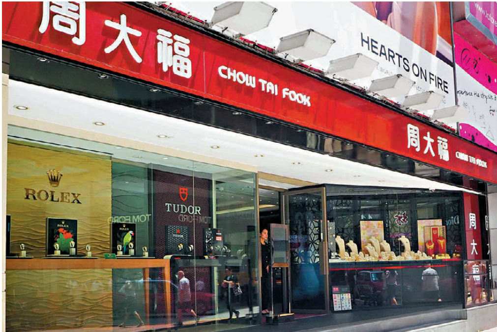
●金價大漲帶動周大福股價節節上升，令鄭家純家族身家大漲。圖為周大福香港門店。

《福布斯》2026年度香港50大富豪榜昨出爐，「十大富豪」中有7個均有涉足地產業務。長和系創辦人李嘉誠身家約3,517.8億港元，今年新增約608.4億港元，成為身家增幅最大的富豪，連續多年穩坐香港首富席位。 已故恒地（0012）創辦人李兆基的長子李家傑與次子李家誠及其家族，以約2,722.2億港元身家位列第二。他們與家族合共擁有349億美元財富，是繼承自去年3月去世、享壽97歲的父親李兆基。恒地積極推進多個新項目，包括備受矚目、投資額達81億美元（約631億港元）、可俯瞰維多利亞港的「中環新海濱」商業項目，預計於2027年起分兩期落成，帶動其股價上升逾40%。 地產及珠寶大亨鄭家純繼續位列第三位，儘管其上市地產附屬公司新世界發展（0017）陷入債務問題，該公司近期證實，控股股東有可能出售部分持股。由於金價飆升，帶動旗下周大福珠寶集團股價幾近翻倍，使他與家族的財富增加66億美元（約514.8億港元），達至261億美元（約2,035.8億港元），保持三甲地位。