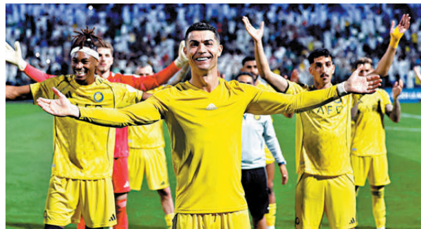
●C朗賽後與隊友一同感謝球迷支持。

香港文匯報訊（記者 楊浩然）葡萄牙巨星C朗拿度，早前據報因不滿沙特阿拉伯公共投資基金（PIF）的行徑而罷踢，結果這位效力沙特豪門艾納斯的41歲老將，終在過去周末聯賽復出，並立即取得入球兼暗示將留隊。 據外電報道，C朗早前因不滿PIF疑似特別關照另一沙特豪門希拉爾，卻未有在上月為艾納斯補強而決定罷踢。幸而經過一番調停後，C朗終在過去周末艾納斯對艾法特的聯賽復出。 狀態依然勇銳的C朗，開賽僅18分鐘便接應沙迪奧文尼的傳送，替艾納斯先開紀錄。在取得入球後，C朗先指着自己，然後指向地面，據報是暗示自己將繼續留效。 比賽方面，艾納斯及後再由艾文耶耶入波鎖定2：0勝局，賽後21戰累積52分排聯賽榜第二位，僅落後希拉爾一分，依然有望爭逐冠軍。