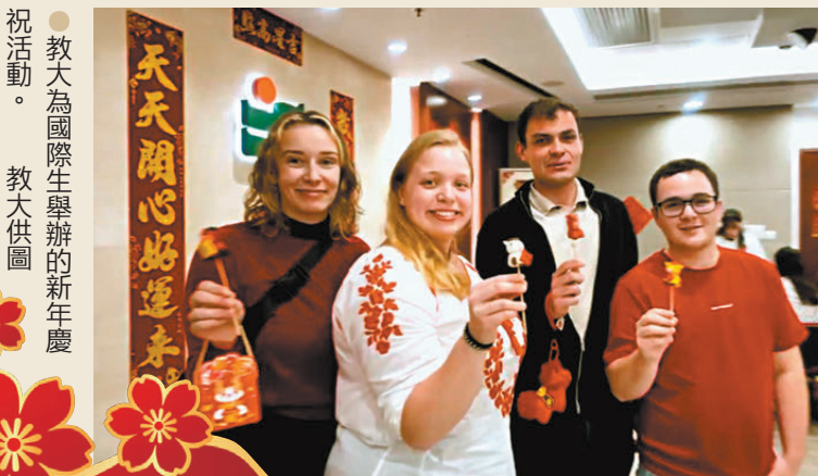
●教大為國際生舉辦的新年慶祝活動。