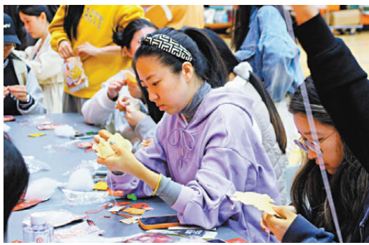
●教大在校園舉辦的新春活動。

留港過年的背後，是國際生們對「節日儀式感」的共同認同，亦是家鄉與香港春節文化的情感連接。來自越南的教大博士生 Lien 坦言，選擇留港是因為「想體驗新事物，遠離日常瑣碎，見識不同的節日風貌」，而香港街頭的年味布置更讓她倍感親切：「越南過春節也會買