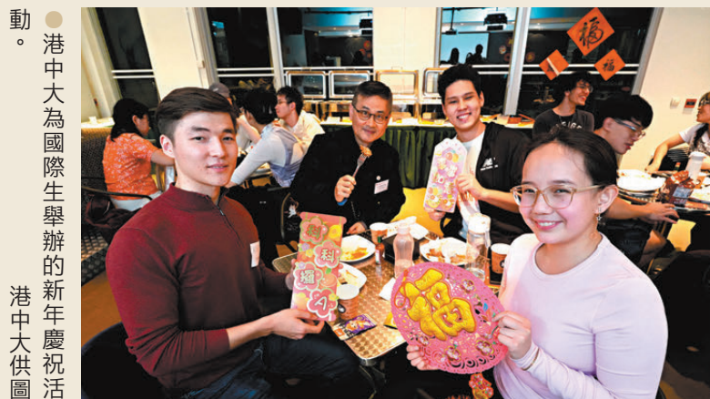
●港中大為國際生舉辦的新年慶祝活動。