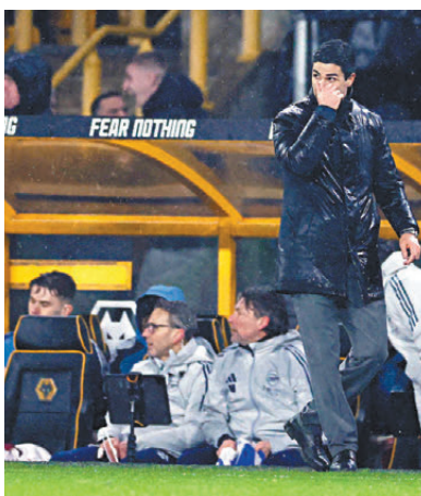
●阿迪達承認賽果令人失望。