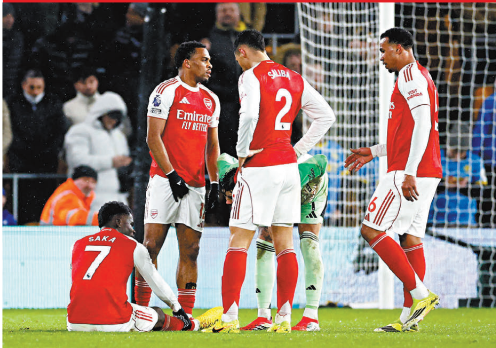
●阿仙奴兩球在手仍遭狼隊逼和，痛失寶貴兩分。