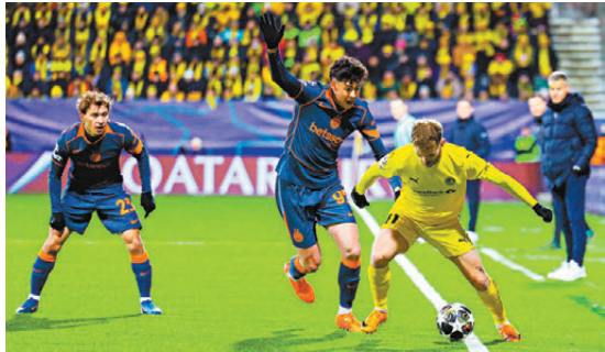
●國米（藍衫）在波杜基林特的「地獄主場」輸波而回。

香港文匯報訊（記者 張發兒）歐聯向來是冷門、奇跡頻現的舞台，來自挪威的波杜基林特正在書寫屬於他們的歷史，他們在昨日凌晨的歐聯16強附加賽首回合，主場爆冷以3：1擊敗國際米蘭，最近三場歐聯接連擊敗曼城、馬德里體育會及國米，刷新隊史歐聯連勝紀錄，次回合只要賽和或輸一球即可歷史性晉身16強。