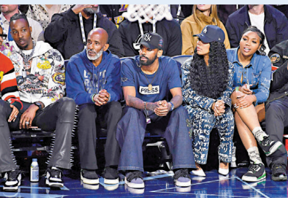
●養傷中的艾榮（中）早前於NBA明星賽公開亮相。