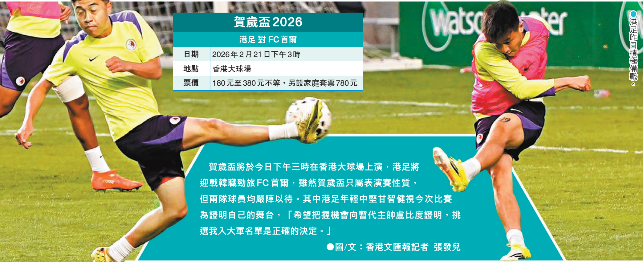
● 港足昨日積極備戰。