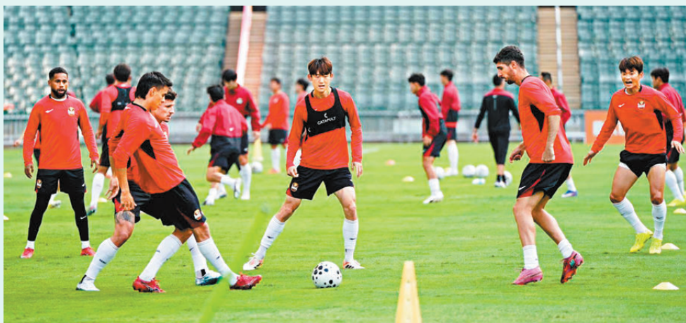
● FC首爾昨日在大球場操練。

至於FC首爾方面，他們來港前已踢了兩場亞冠精英盃分組賽，分別以0：2不敵神戶勝利船，以及在領先兩球的情況下遭廣島三箭賽和2：2，教練金基東指球隊的表現已經有所進步，會視今仗為備戰新賽季第一場聯賽的好機會，「要去解決上場出現的問題，這是我們的首要目標，另外香港的天氣比韓國熱，相信球員能夠盡情發揮。」金基東又稱希望未來能夠有機會再與港足比賽，「若然有機會的話，我都想邀請港足到韓國與我們比賽。」