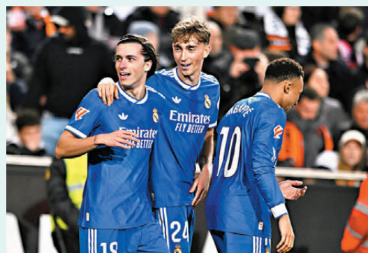
● 皇馬有力言勝。資料圖片

香港文匯報訊（記者 楊浩然）西甲「一哥」皇家馬德里將於香港時間周日（22日）凌晨造訪奧沙辛拿。皇馬目前以兩分領先過去周中失分的巴塞隆拿，為保領前優勢是役不容有失，幸而主隊奧沙辛拿近況平平，近三戰僅一勝，相信難對「銀河艦隊」構成威脅。（Now632台周日1：30a.m.直播）