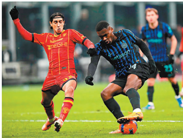
● 國際米蘭（右）在分心出戰下，造訪萊切有隱憂。資料圖片

「五哥」車路士今輪比賽將主場對般尼（Now611、621及631台今晚11：00p.m.直播）。車路士在新帥羅仙尼亞帶領下，聯賽近五戰得四勝一和表現對辦，配合主場之利該無懼近四戰三敗的般尼。