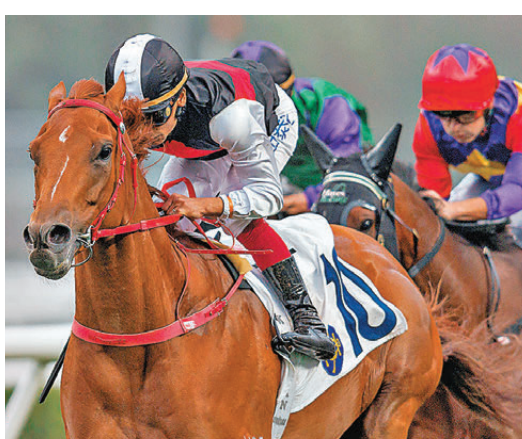
●「競駿輝煌」超過一年未贏馬，今場必拚無疑。

今期先推介第三場四班1000米，蔡明紹近期手風欠順，我個人傾向等他開齋才投注其獨贏，但若有賠率的話，也不會抗拒拖返一票。「萬眾開心」今場重戴防沙眼罩出賽，估計會採用留前門後跑法，畢竟今場步