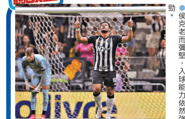
●侯克老而彌堅，入球能力依然強勁。