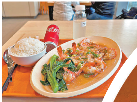
香港仔街市熟食市場

在這裏燒了兩百多年，見證無數漁民出海、歸航。 原本計劃去鴨脷洲熟食中心吃海鮮，可惜遇上裝修。沒關係，再坐街渡回香港仔，直奔香港仔街市熟食中心。點一份蒜蓉大蝦，大大一盤，新鮮彈牙，價錢比艇仔粉還便宜。摸着肚皮小憩一會，看着街坊聊天說笑，這種悠閒時光，也是旅程中放鬆時間之一。