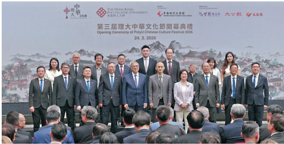
●理大舉行「第三屆理大中華文化節」開幕典禮。

理大中華文化節開幕典禮由中央駐港聯絡辦教育科技部一級巡視員劉懋洲擔任主禮嘉賓,聯同理大校董會主席林大輝、校長滕錦光、常務及學務副校長黃永德、高級副校長(研究及創新)趙汝恒、副校長(教學)曾建農、副校長(學生及環球事務)兼理大中華文化節主席楊立偉,以及暫任副校長(校園及設施)劉文彪一同主持啟動儀式。