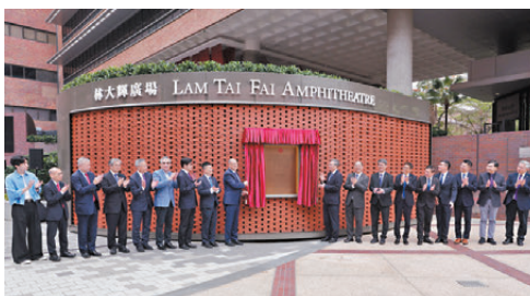
●理大「林大輝廣場」昨日舉行揭牌儀式。

據悉,理大於2015年將賽馬會綜藝館門前的廣場命名為「林大輝廣場」,廣場優化工程於2024年展開,沿用扇形設計,總面積約1,100平方米,梯級觀摩席可容納約200名觀眾,適用於舉辦各類文化展覽、演出、戶外及校園活動。