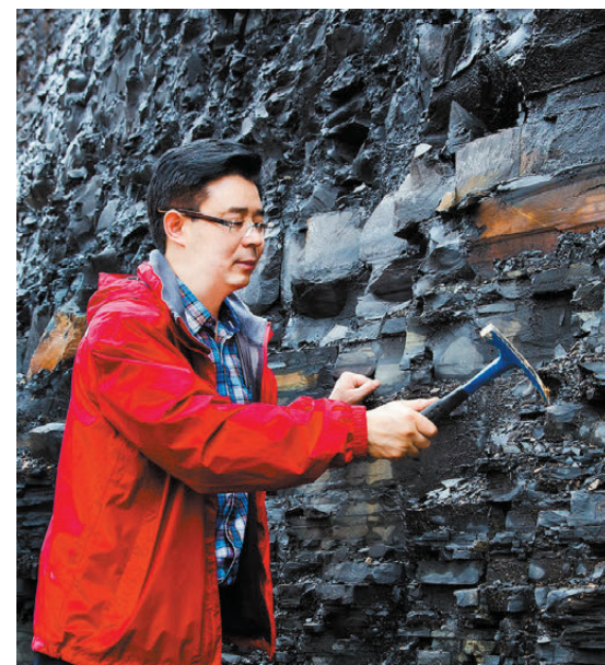
●鄒才能院士在察看四川盆地頁岩露頭。

鄒才能表示，中國煤岩氣資源潛力很大。鄂爾多斯等盆地有良好的勘探前景。不僅如此，放眼世界，煤岩廣泛分布，美國、俄羅斯、澳大利亞、加拿大等國煤岩氣資源應該也很豐富，或將成為繼頁岩氣之後天然氣產業發展新的增長極。