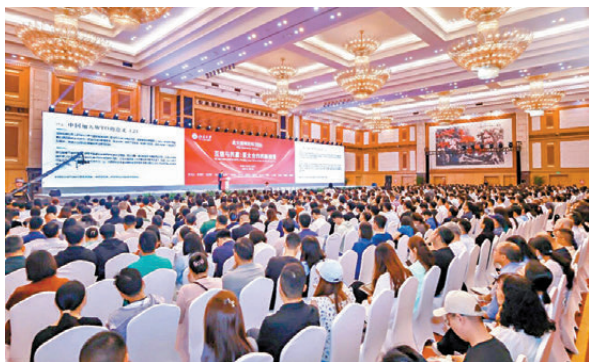
●北大深圳論壇2026在深圳舉行。

宏觀政策越來越開放，但微觀層面的開放還不夠，需要落到實處。例如海南自貿港的開放政策在微觀層面還需要進一步落地。