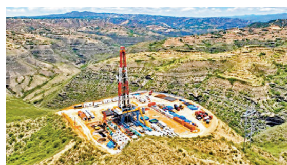
●山西大吉氣田。央視截圖