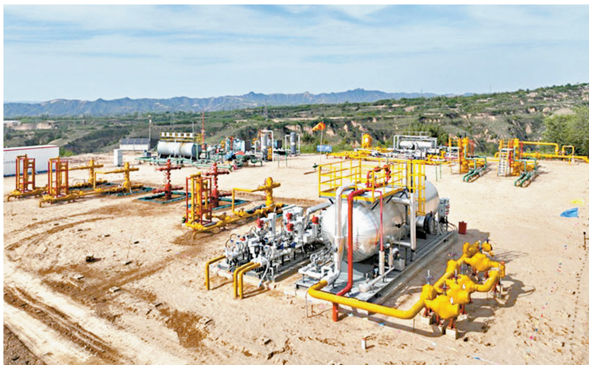
●鄂爾多斯盆地率先建成大吉等煤岩氣生產基地。圖為中石油煤層氣有限責任公司在鄂爾多斯盆地山西大吉氣田開發煤岩氣現場。

發揮了重大作用，在非常規油氣地質學理論引領推動下，從2008年中國非常規油氣總產量佔比2.4%，攀升至2024年佔比27%，其中非常規天然氣產量1,077億立方米，佔天然氣產量的44%。