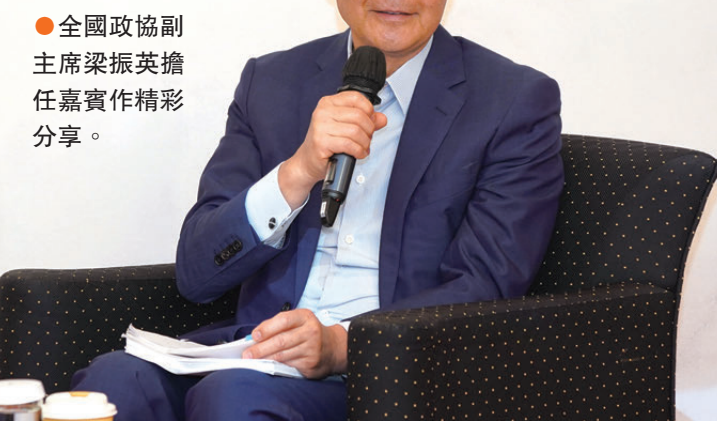
●全國政協副主席梁振英擔任嘉賓作精彩分享。

在活動現場，來自香港大學精算系的學生葉嘉杰向梁振英請教關於港青加入政府的發展機遇問題。對此，梁振英表示，青年若有意加入政府，需謹記「為做事而非為做官」。他強調，公務員絕不僅僅是一份工作，更承載使命與擔當。香港需要有情懷、有擔當的青年接棒，為社會發展貢獻力量。