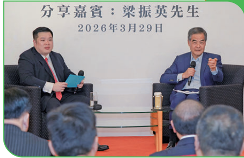
●分享會由龍允生（左）擔任主持，梁振英（右）詳細解答現場青年提出的問題。