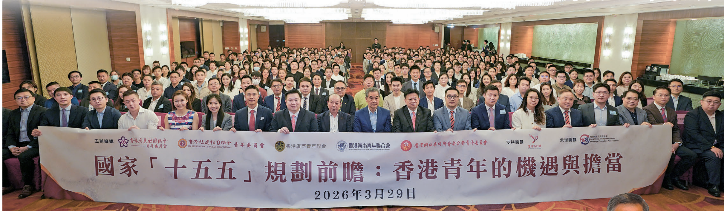
●香港廣東社團總會青年委員會聯同香港福建社團聯合會青年委員會、香港廣西青年聯會、香港海南青年聯合會、香港浙江省同鄉會聯合會青年委員會舉辦「國家「十五五」規劃前瞻：香港青年的機遇與擔當分享會」，近400名青年出席。

3月29日，香港廣東社團總會青年委員會聯同香港福建社團聯合會青年委員會、香港廣西青年聯會、香港海南青年聯合會、香港浙江省同鄉會聯合會青年委員會舉辦「國家「十五五」規劃前瞻：香港青年的機遇與擔當分享會」，會議邀得全國政協副主席梁振英作分享嘉賓，引導香港青年深入理解國家發展大局，把握國家發展機遇，強化青年在建設香港、貢獻國家中的責任擔當。