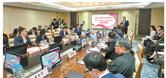
「國家『十五五』規劃下的香港新定位——從金融中心到國家產業資本化平台」學習分享會昨日舉行。

查毅超介紹香港科技園作為本港最大創科生態圈，具備科研、創新製造、融資三大獨特優勢，並聚焦人工智能、綠色科技、生命科學、先進製造等「十五五」重點產業，助力香港創科由陪跑轉向領跑，迎來創科黃金時代。