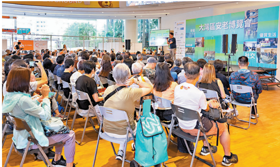
●圖為去年在香港舉辦的大灣區安老博覽會，向長者介紹跨境安老資訊。

國家「十五五」規劃綱要明確提出要加大保障和改善民生力度，扎實推進全體人民共同富裕。負責統籌編制香港五年規劃的香港特區政府政制及內地事務局初步釐定專題諮詢的6個綜合範疇中，就包括民生和社會發展，將聚焦就業、醫療、教育、關愛共融等市民最關心的議題。香港文匯報就有關議題訪問了各界人士，他們認為香港五年規劃最重要是「貼地」，必須先了解市民和社會需要，諮詢各持份者的意見，凝聚社會共識，又期望藉五年規劃編制的契機，從制度設計、資源投入、服務優化等方面補齊短板、完善體系。