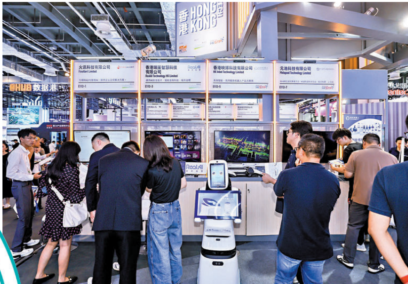
●圖為香港AI企業去年在世界人工智能大會上展出。 資料圖片

香港特區政府將於年內完成編制香港五年規劃，過程中，特區政府和立法會的協同研究及意見收集機制，廣納各界及持份者意見，以期做好主動對接國家「十五五」規劃的工作。主責統籌的政制及內地事務局已初步釐定了6個綜合範疇作專題諮詢，香港文匯報由今天開始將逐個範疇透過相關業界與持份者的建言，讓讀者更了解各議題的發展與未來機遇。