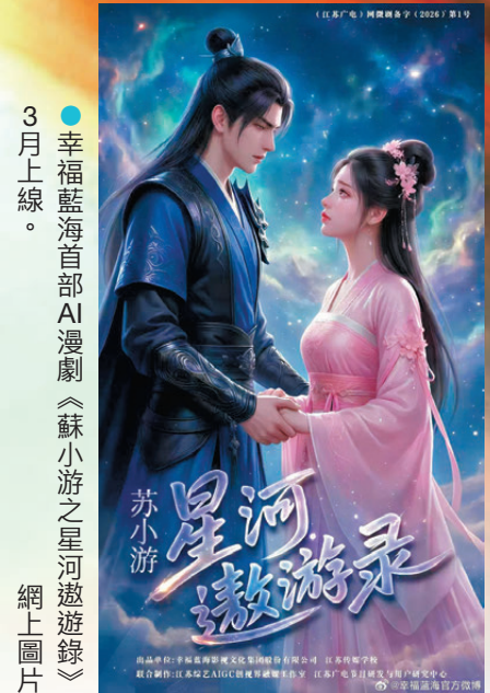
3月上線。幸福藍海首部AI漫劇《蘇小游之星河激遊錄》