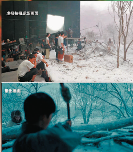
●《反人類暴行》中AI燈光演算法大幅減少後期工作量。