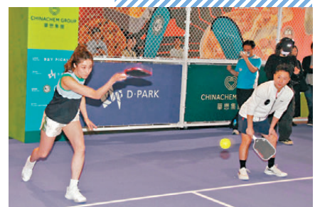
●鍾嘉欣打球爭勝心強烈，不時施展扣殺。

月中會到佛山開演唱會的嘉欣，表示今次是她的生日限定場，歌單和舞蹈都會跟之前有修改。而今年嘉欣也會主力做音樂，更考慮寫一首關於匹克球的熱血勵志歌，從而鼓勵更多人