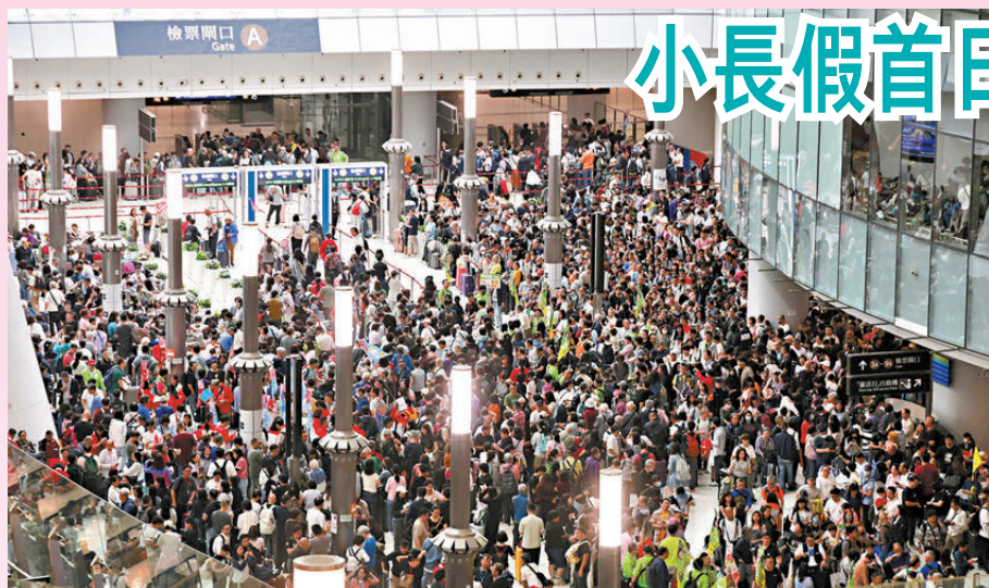
●香港文匯報記者昨日到西九龍高鐵站直擊，現場呈現一派熙熙攘攘的熱鬧景象，處處可見人潮聚集，檢票閘口擠滿等候的乘客。