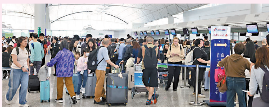
●香港國際機場離境櫃位人頭湧湧。

香港文匯報訊(記者 張茗、蕭景源)復活節與清明節緊鄰的5天小長假首日從昨日(3日)開始，香港文匯報記者到西九龍高鐵站及香港國際機場了解情況，發現現場熙熙攘攘、非常熱鬧，處處可見人潮聚集。據香港特區政府入境處數字顯示，截至昨晚9時有近110.3萬人進出香港，其中離開的本地居民有68.5萬人，另有11.1萬旅客抵港，內地旅客佔7萬人，而羅湖口岸出入境人數最多，有21萬人次進出，其次是落馬洲支線口岸，有18.8萬人次進出。