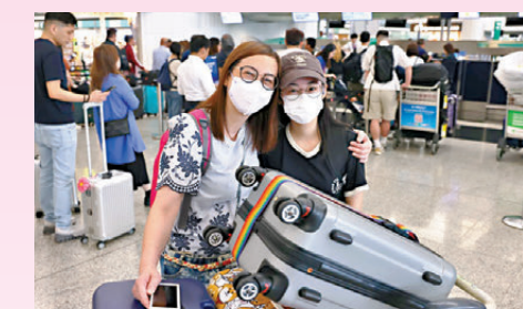
●譚女士(左)與丈夫及女兒一家三口參加馬來西亞檳城5天團。

州玩兩天，整個旅程近一周。他說，機票價格尚可，未因燃油費上調感到壓力，且已提前買好回程機票。他們在港期間會逛商場購買服裝鞋履。