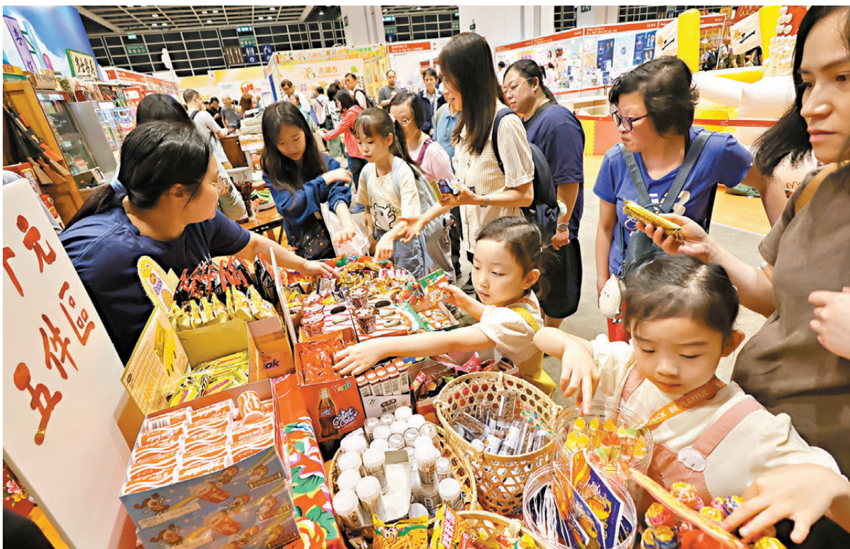
●「香港國際試食暨優質食品博覽2026」昨日開幕，會場設「美樂士多懷舊專區」，重現香港上世紀七八十年代懷舊土多，超過30款懷舊小食、玩具等。

一連5天的復活節連同清明節小長假期展開，由展覽集團主辦的「香港國際試食暨優質食品博覽2026」昨日於香港會議展覽中心開幕，展期至本月7日假期最後一天。博覽匯聚國際特色食材、優質食品及各地伴手禮，主打「預先試食後購買」，讓入場人士試盡全場近500個攤位的環球美食，開幕首日即吸引大批市民蜂擁而至，場內人頭攢動，試食人龍處處可見，氣氛熱鬧。有來自廣州的展商表示，香港作為國際貿易樞紐，是連接內地與全球市場的重要跳板，期望透過是次博覽，物色香港代理商或合作夥伴。有市民則已花費約500多元購買飲品及麵食等，因擔心假期外遊人多擠迫，故選擇留港消費。