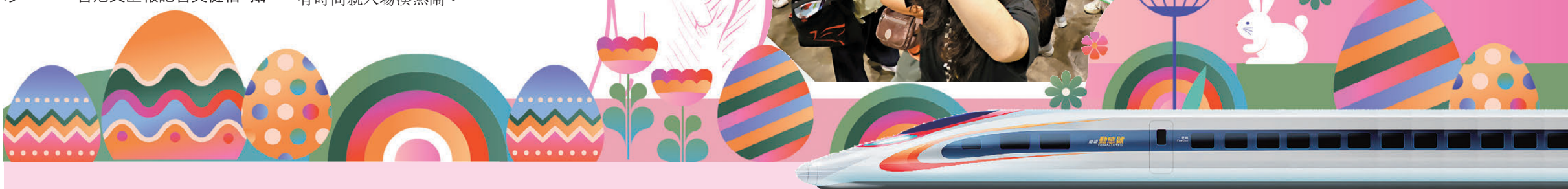
●大批市民排隊入場領取燒豬。

他進一步表示，今年博覽首次引入全港首創「超人氣角色食玩館」、「絲路上一帶一路專區」等多個全新主題展區，同時帶來「歡樂天地嘉年華」及「中年靚聲王音樂會」等豐富節目，打造一個融合美食、文化、娛樂與城市體驗的綜合平台，讓入場人士無論大人、小朋友或長者，都能食、買、玩一次滿足，以嶄新多元的美食體驗吸引更多本地市民入場，同時吸引大灣區以至海外朋友專程來港，感受香港的美食魅力，並期望延續這項活動，成為屬於全香港人的年度美食盛事及城市品牌一部分，為推動本地零售發展及提振香港經濟貢獻力量。