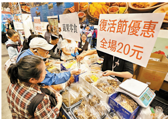
●除供市民試食外，有參展商以優惠價格招徠。