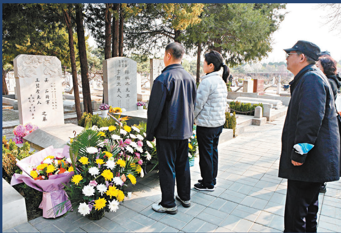
▲清明寄哀思緬懷英烈，民眾自發獻花祭拜吳石將軍，表達自己的尊敬與緬懷。