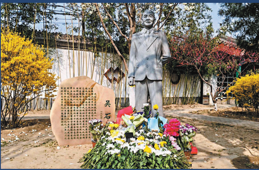
▶民眾專門來到吳石將軍的雕像前獻花。

清明將至，緬懷英雄的氛围愈發濃厚，每日前往祭拜吳石將軍的群眾較往日明顯增多，不少人帶着鮮花、祭品，靜靜佇立在墓碑前，追憶英雄事跡。工作人員透露，為方便民眾祭拜，福田公墓長期開放團隊預約祭掃。今年清明服務接待期間，福田公墓將在非高峰日的下午開放團體預約，並免費提供講解和祭奠主持服務。據了解，團隊祭掃需發函至福田公墓電子郵箱，待審核通過後方可進行祭掃。