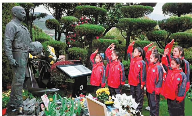
●臨平區崇賢第一小學的學生們向王偉烈士敬禮。

今年20歲的「軍事迷」丁波從安徽趕來，帶來了一個「殲-35」模型，「我想讓王偉烈士看看我們國家在軍工領域的最新進展。這廣闊的天空，我們一代代接續守護。」浙江