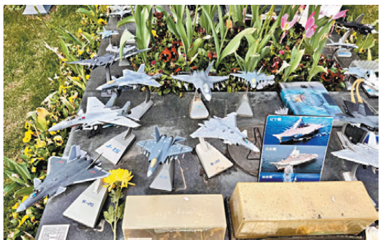
●王偉烈士的墓前擺放了現代化戰機模型。

安賢園園工作人員告訴香港文匯報記者，這些年，王偉墓前擺放的戰機模型越來越多，幾乎擺滿了整個墓地。「這是英雄留在心裏最好的證明。」 時光回溯，2001年4月1日，海軍航空兵飛行員王偉為保衛祖國領空，駕駛戰機跟蹤監視闖入中國南海領空的美軍偵察機，遭美機突然轉向撞機後跳傘墜海，壯烈犧牲。那年王偉33歲，中央軍委追授其「海空衛士」榮譽稱號和一級英模模範獎章。 為了讓更多人能夠跨越時空表達緬懷，浙江安賢園還設立了「海空衛士王偉線上紀念館」。市民們掃描墓碑旁的二維碼，即可進入虛擬紀念空間，觀看英雄生平事跡，留下緬懷寄語。 ●香港文匯報記者 俞書 杭州報道