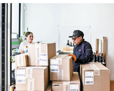
●美國進口商、企業及民眾承擔逾九成關稅成本。

國、日本、加拿大及韓國等國家的股市。民調顯示，美國民眾普遍對特朗普的貿易政策失去信心。皮尤研究中心最新調查發現，58%受訪者表示不信任特朗普能在貿易政策上作出正確決定，63%對其關稅政策表示僅有微弱信心或沒有信心。