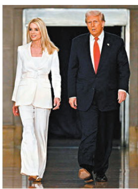
●邦迪(左)失去特朗普的信任。 資料圖片

香港文匯報訊 美國總統特朗普4月2日宣布撤換上任僅約一年的司法部長邦迪，並委任曾擔任特朗普私人律師的現任司法部副部長布蘭奇暫代職務。多間美媒報道，特朗普對邦迪未能在他要求的針對「政敵」的起訴中取得進展感到沮喪。同時，她對涉及已故富豪淫媒愛潑斯坦案件相關檔案的處理方式，也引發兩黨共同不滿。