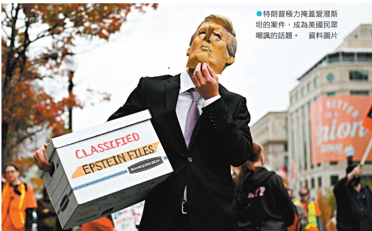
●特朗普極力掩蓋愛潑斯坦的案件，成為美國民眾嘲諷的話題。

布蘭奇由於曾長期擔任特朗普的私人律師，外界預料他將使司法部進一步貫徹特朗普的意志，動用法律體系針對政敵。至於正式繼任人選，美聯社2日引述3名知情人士透露，特朗普私下討論過由環境保護署(EPA)署長澤爾丁接替，作為永久人選。