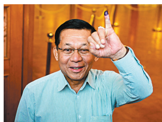
●敏昂萊以高票當選緬甸總統。 資料圖片

中國外交部發言人毛寧3日在例行記者會上表示，中方祝賀敏昂萊當選緬甸總統。毛寧說，中緬是傳統友好鄰邦和命運共同體，中國對緬友好政策面向全體緬甸人民，中方支持緬甸新政府維護國家和平穩定，實現發展繁榮，願同緬方共同努力，落實好四大全球倡議，積極推進高質量共建「一帶一路」合作，推動中緬命運共同體建設取得更多務實成果，更好造福兩國人民。