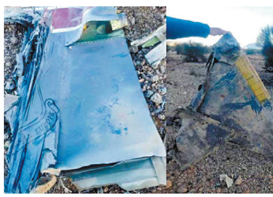
●伊朗媒體公布F-35戰機解體碎片的照片，表示飛行員生還率很低。網上圖片