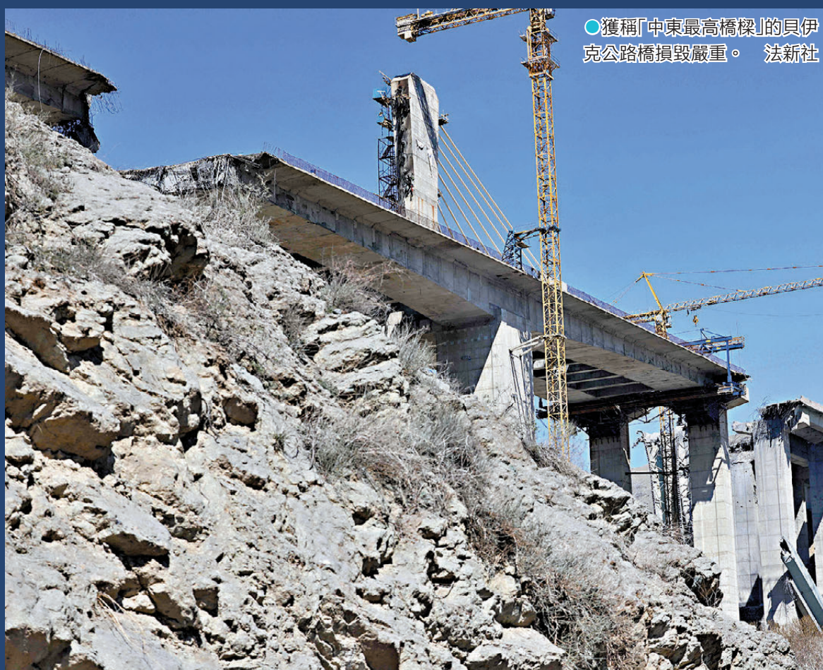
●獲稱「中東最高橋樑」的貝伊克公路橋損毀嚴重。法新社