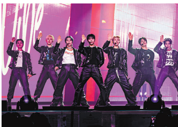
●NEXZ展現力量與性感並存的舞台魅力。

香港文匯報訊(記者阿祖)新生代韓國男團NEXZ近日首次訪港，於亞洲國際博覽館舉行一連兩場的《NEXZ SPECIAL CONCERT IN HONG KONG》。出道僅一年多、平均年齡僅19.1歲的NEXZ首次踏足香港舞台，難掩興奮之情，七位成員以校服造型帥氣登場，甫開場便帶