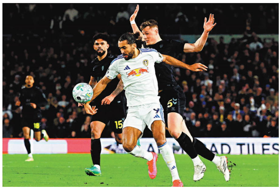
●列斯聯要靠卡維特利雲(白衫)支撐前線。