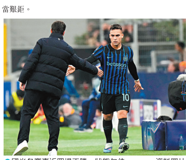
●國米各賽事近四場不勝，狀態欠佳。 資料圖片

羅馬在經歷各項賽事五場不勝後，於國際賽期前主場以1：0擊敗萊切，繼續保持爭奪前四的希望。羅馬目前落後第四名三分，若要收窄差距，便需要在聯賽連勝，但羅馬近四場聯賽作客輸掉三場，這項任務似乎相