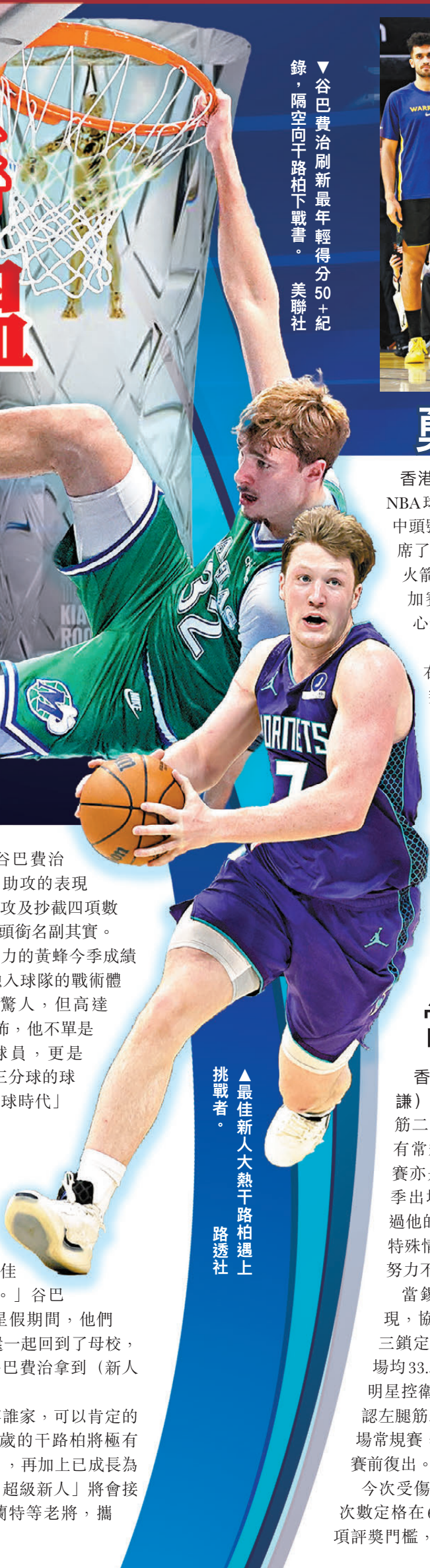
▼谷巴費治刷新最年輕得分50+紀錄，隔空向干路柏下戰書。

無論最終「新人王」獎項花落誰家，可以肯定的是只有19歲的谷巴費治以及20歲的干路柏將極有機會成為未來NBA的新「門面」，再加上已成長為「外星人」的雲班亞馬，三名「超級新人」將會接棒勒邦占士、史提芬居里及杜蘭特等老將，攜手拉開NBA新時代的序幕。