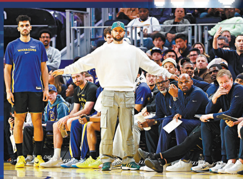
●居里有望下場對火箭復出。