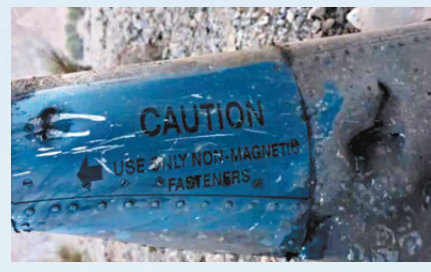
●伊朗展示被擊落的美戰機殘骸。