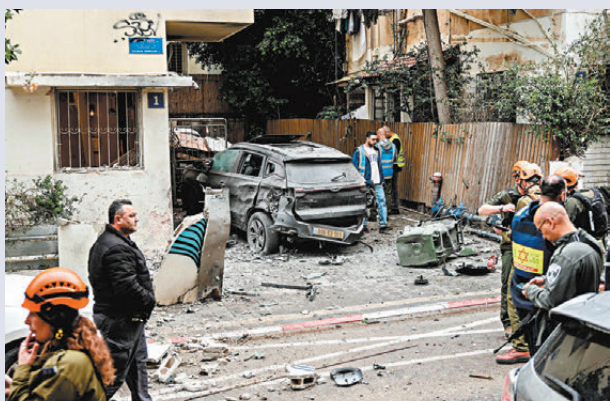
●中東安全形勢高度緊張，戰事擴大升級風險仍然極高。圖為以色列一處民居被擊中。

使館說，將於7日再組織一批在以中國公民(包括港澳同胞)通過埃及塔巴口岸轉移撤離，在以同胞特別是身處高風險地區的同胞，可通過使館渠道登記個人信息，並做好有關準備。