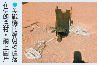
●美戰機的彈射椅遺落在伊朗農村。

●美軍F-15E戰機在伊朗上空被擊落，兩名飛行員一人獲救、一人下落不明。