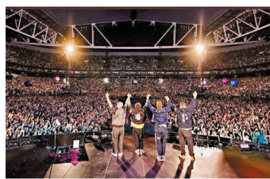
●議員建議將大型演唱會等帶來的經濟效益一併計入指標。圖為英國著名樂隊Coldplay巡迴演唱會。

除重要體育賽事外，大型演唱會亦十分關鍵，能吸引周邊地區旅客來港，對零售、餐飲、酒店等行業帶來更大經濟效益，因此在指標調整時，可一併考慮此類演出對經濟的綜合效益。啟德體育園過去一年的整體表現不俗，對本地經濟帶來實際貢獻。