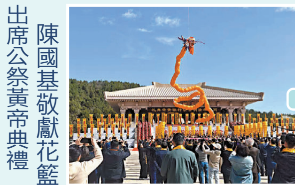
陳國基敬獻花籃 出席公祭黃帝典禮