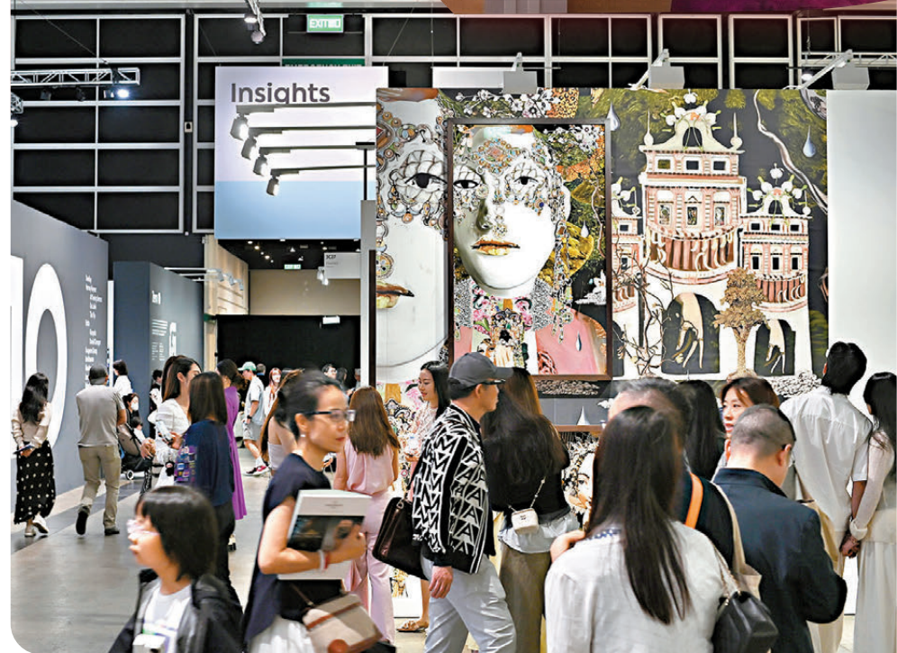
●2026年巴塞爾藝術展早前舉行，不少市民和遊客到場參觀。