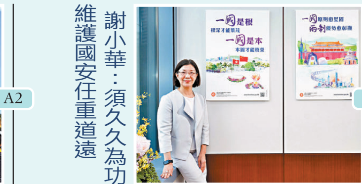
謝小華：須久久為功 維護國安任重道遠