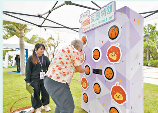
●「我好『叻』」社區健康推廣計劃。