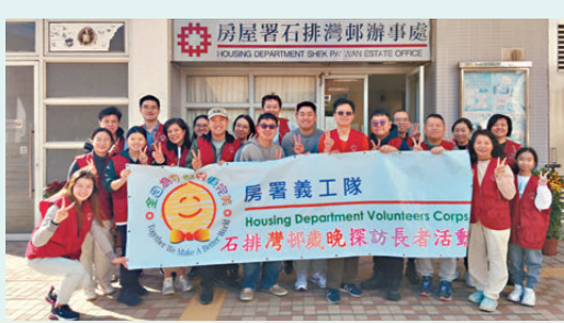
●房委會推動「關愛長者·鄰里互助」理念，鼓勵街坊及長者參與義工服務。