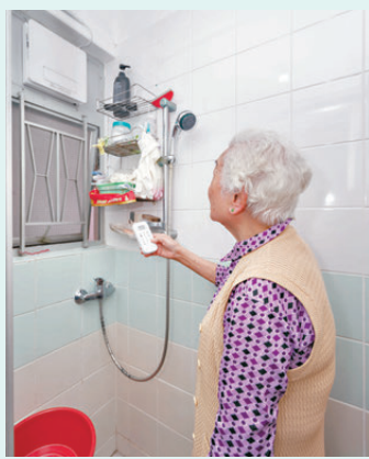
●房委會與煤氣公司合作，向長者送贈及安裝約700部「浴暖寶」。