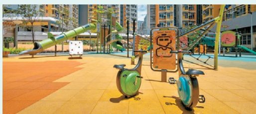
●「綜合社區休憩遊樂」將屋邨的兒童遊樂場與長者健體設施整合，創造跨代共融空間。