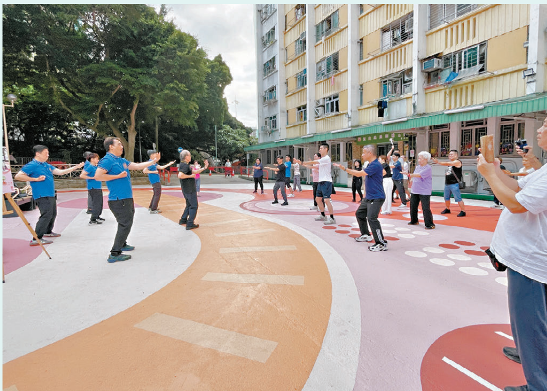
●「邨『友』好事」打破年齡隔閡與社區邊界，將關愛長者融入屋邨日常，資助各屋邨舉辦多元化活動，促進青中老三代居民互動交流。圖為邨內街坊一起做運動。

針對舊式屋邨樓宇部分樓層未有升降機到達，行動不便長者出行困難問題，房委會今年1月起安排供應商在友愛邨及樂富邨測試新型遙控操作「樓梯機」，將根據測試成效、居民接受度及個別屋邨實際情況，安排合適的「樓梯機」，方便住戶出行。