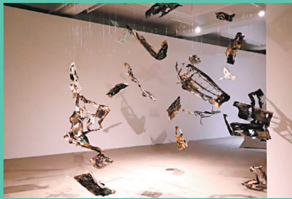
●陸浩明《靜止的點燃的葉子》，2017