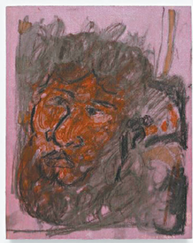
●Walter Price《Black Jesus》

Walter 將其大部分個展都命名為「珍珠線」，以表明每場展覽都超越了特定時間與地點的限制，成為他更宏大創作的一部分。他運用反覆出現的主題，貫穿現實和夢境、記憶與集體歷史：局部渲染的汽車、傢