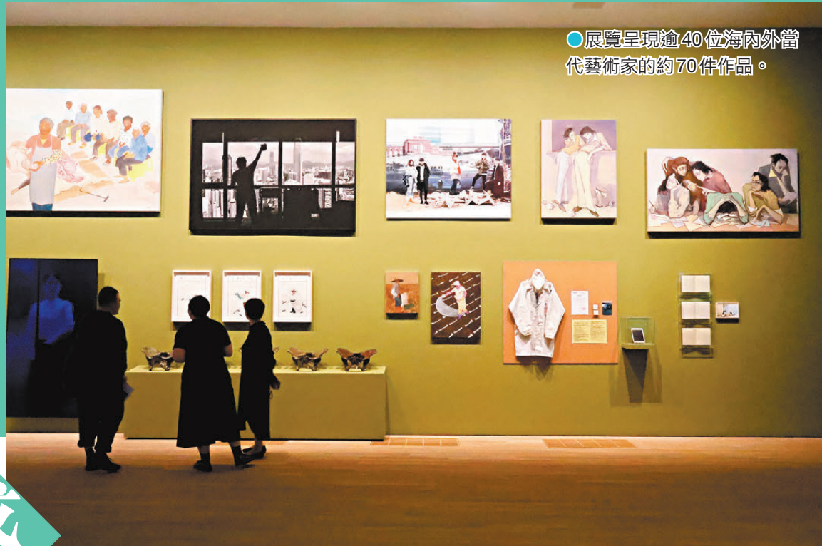
●展覽呈現逾40位海內外當代藝術家的約70件作品。