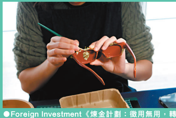
●Foreign Investment《煉金計劃：徵用無用，轉廢為用》，2026