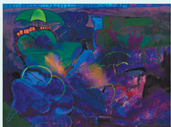
●Walter Price《Leaky roof》

具、動物、星星等元素，在其筆下層疊的圖景中若隱若現，與畫面中鮮活且具反差的色塊、充滿質感的筆觸、神秘的題字，以及蜿蜒迴轉的線條並置，留給觀眾自行吸納與冥思的種種場景與意象。