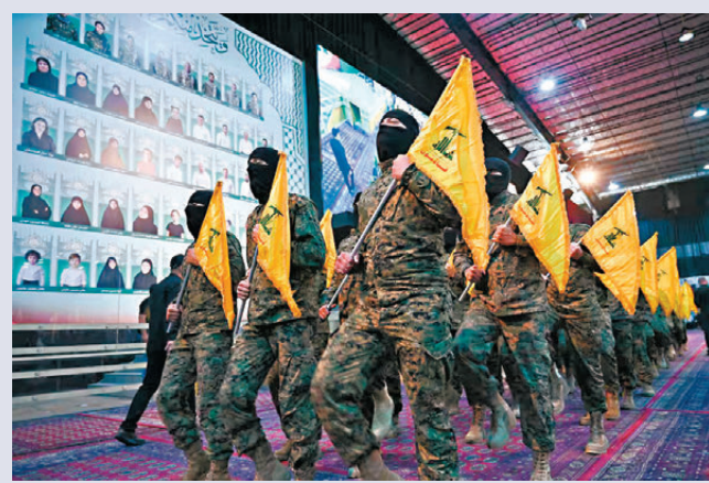
●真主黨仍有能力發射大量火箭。網上圖片

香港文匯報訊 以色列第12頻道電視台4日晚播出的錄音顯示，一名以軍將領承認，以軍低估了黎巴嫩真主黨的實力，並認為伊朗政權依然穩固，或許最終需要與伊朗達成「某種協議」。