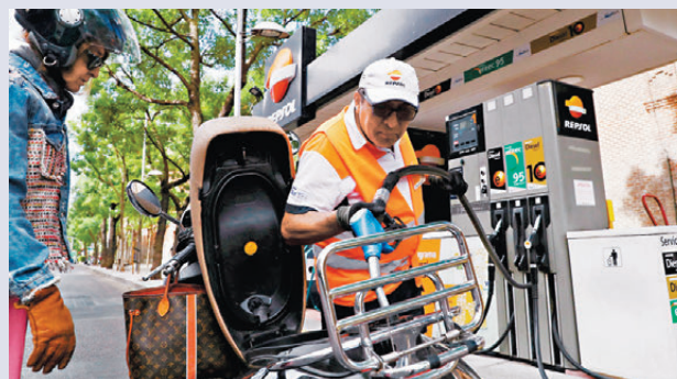
●中東衝突給歐洲經濟帶來巨大負擔。圖為西班牙一個加油站。

香港文匯報訊 歐盟委員會發言人證實，收到5個歐盟成員國要求對能源企業徵收暴利稅的提議，正對此進行評估。