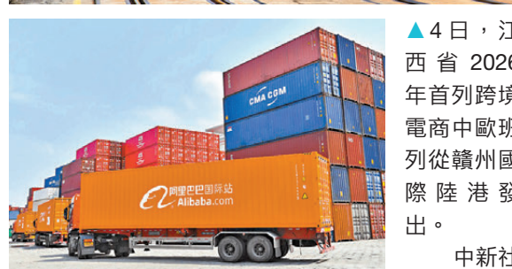
●阿里巴巴海外倉。網上圖片