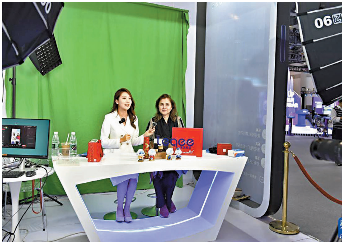
●早前，在第二屆全球數字貿易博覽會絲路電商館，外賣在「絲路電商日」活動中體驗電商直播。