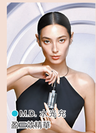
●M.D. 水光充盈三效精華