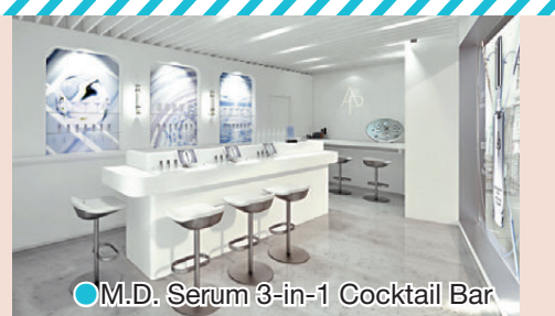
●M.D. Serum 3-in-1 Cocktail Bar

由即日起至4月14日，品牌於銅鑼灣崇光百貨設立「M.D. Serum 3-in-1 Cocktail Bar」，並與韓式小吃酒吧O'rim合作。由